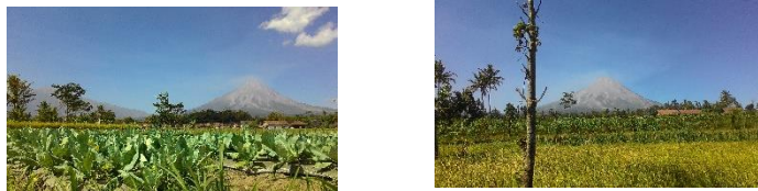
Gambar 5. Lanskap dan (view) yang menarik merupakan Modal Sumber Daya Alam