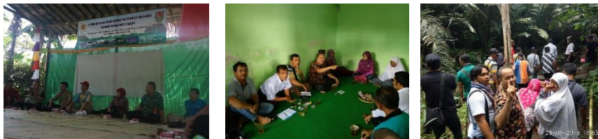
Gambar 4. Musyawarah dan mufakat proses pengambilan keputusan