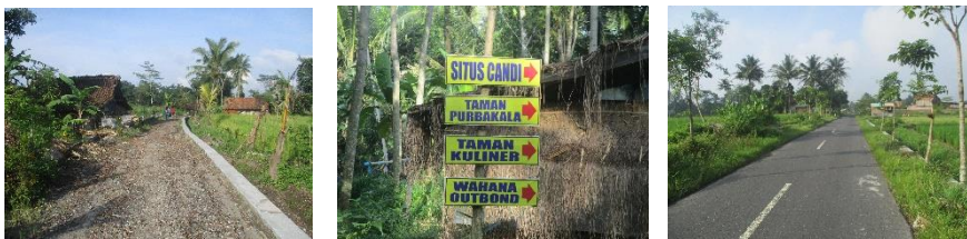
Gambar 3 Infrastruktur jalan sebagai modal fisik di desa Kalibening.