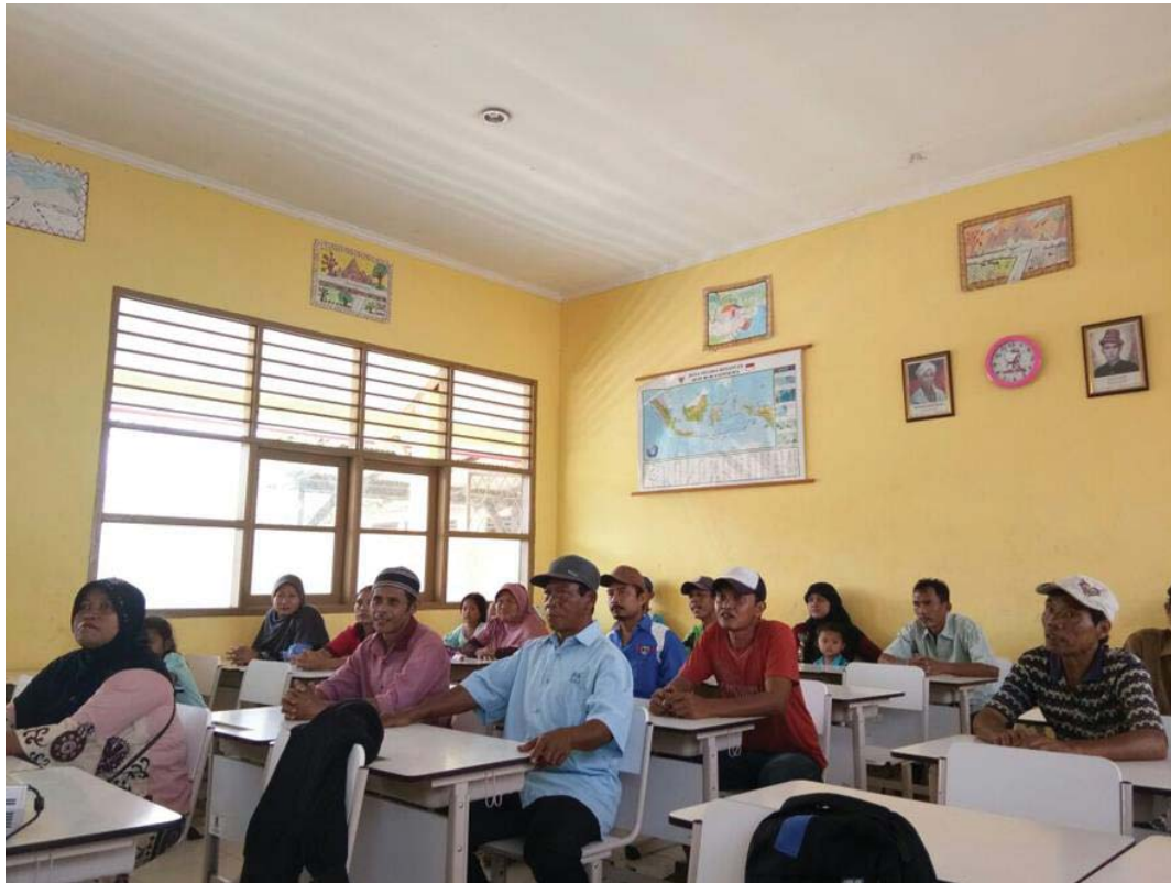
Gambar 4. Foto peserta yang menyimak pelatihan Kewirausahaan dan Pemasaran.

Pelatihan berbentuk workshop ini berjalan lancar ditandai dengan adanya kuis yang dilakukan untuk mencari tahu seberapa peserta mengerti tentang materi yang telah disampaikan. Beberapa pertanyaan tentang materi dijawab dengan lancar oleh peserta, peserta mengatakan bahwa acara ini bermanfaat untuk mereka, bagi yang akan membuka usaha dan sedang merintis usaha kecil menengah. Mereka antusias untuk menjawab hingga acara semakin menarik. Peserta yang menjawab diberi reward , reward yang diberikan adalah alat rumah tangga yang diharapkan dapat berguna bagi peserta. Akhirnya acara pelatihan ditutup dengan doa dan foto bersama.