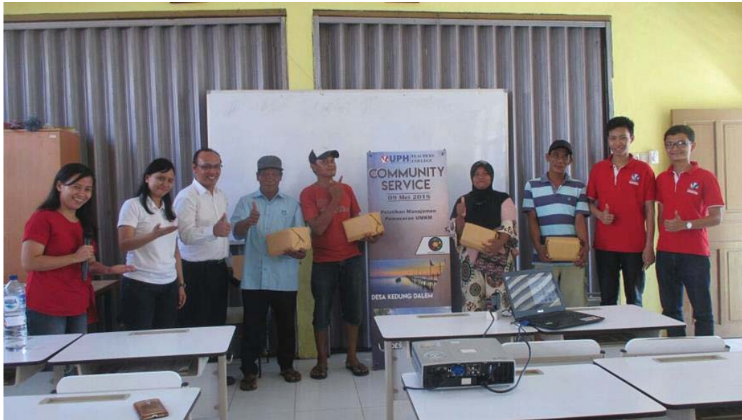
Gambar 5. Foto peserta yang mendapatkan reward dari mengikuti kuis.

Pelatihan Kewirausahaan yang dilakukan ini menurut peserta secara lisan dikatakan berguna dan peserta mengerti isi materi pelatihan yang dibawakan, walaupun tidak secara khusus tertulis ditanyakan pada peserta, sebagai contoh dalam acara kuis pembawa acara bertanya “apakah peserta mengerti tentang pelatihan ini?” lalu peserta menjawab “mengerti !”.