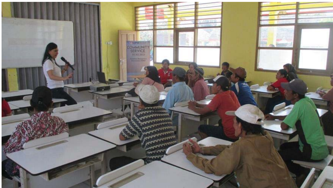
Gambar 3. Foto acara pelatihan yang dibawakan oleh penulis.