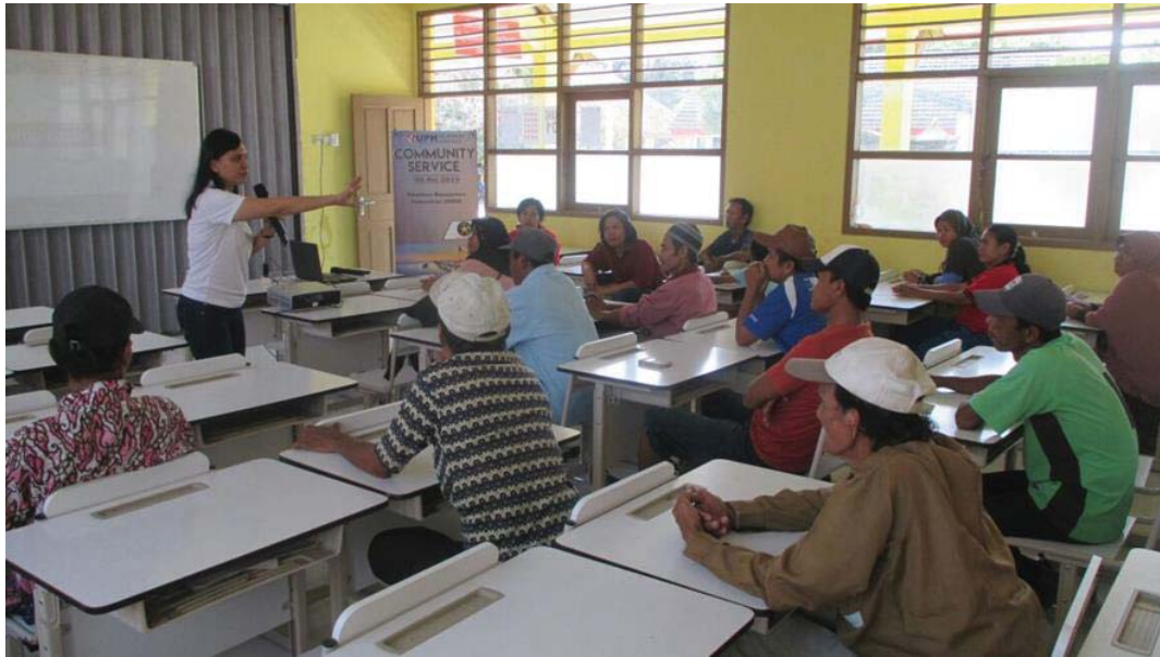
Gambar 2. Foto acara pelatihan yang berbentuk workshop.