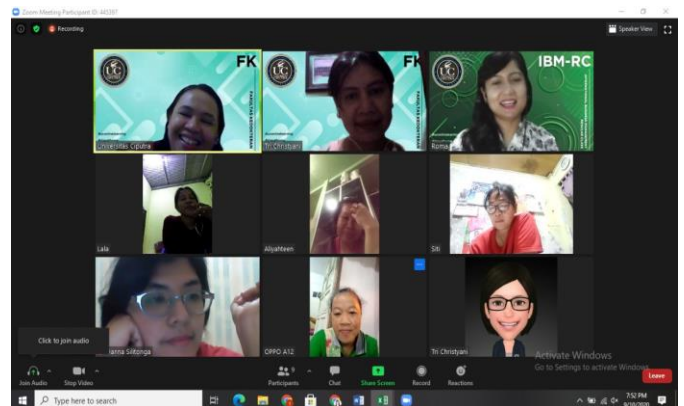
Gambar 3. Pelatihan Pengetahuan Keuangan