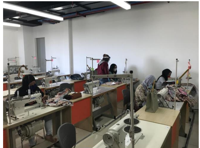
Gambar 2. Pelatihan Keterampilan Menjahit Seprei

Keberlanjutan program ini di masa mendatang yaitu melakukan pendampingan dan evaluasi pengelolaan keuangan usaha mikro milik mitra. Secara khusus pengelolaan keuangan usaha menjual seprei. Pendampingan terhadap mitra dalam menjual seprei menggunakan 2 metode yaitu memasarkan secara online dan bergabung dalam E-Commerce Shopee.