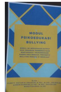
Gambar 4. Modul Psikoedukasi Bullying