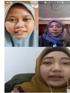
Gambar 2. Aktivitas yang dilakukan dengan media Video Call Group