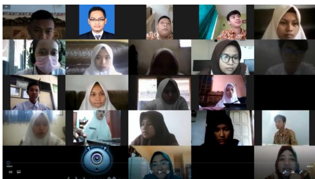
Gambar 1. Pelatihan yang dilakukan dengan media zoom