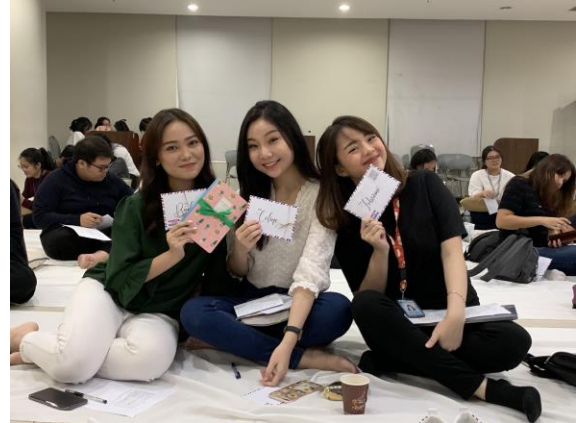
Gambar 1 Peserta seminar menunjukkan surat untuk diri sendiri

Welas diri perlu dilatih dan dibiasakan dalam hidup. Untuk membantu mahasiswa mempraktikkan welas diri, maka pada sesi kedua, peserta diberikan kesempatan untuk melakukan aktifitas welas diri. Kegiatan yang pertama adalah dengan memberikan kata-kata positif terhadap diri sendiri dengan cara berdiri, dengan tangan kanan memegang dada kiri dan menirukan kalimat yang diucapkan oleh pembicara. Aktifitas yang kedua adalah membuat surat. yang ditujukan kepada dirinya sendiri. Surat tersebut dibuat dengan menggunakan perspektif dari orang lain yang akan memberikan penilaian mengenai kondisi peserta secara jujur dan penghargaan terhadap semua hal yang telah dilakukan oleh peserta selama ini. Setelah selesai membuat surat, peserta diminta untuk memasukan surat tersebut ke dalam amplop untuk dibawa pulang dan dibaca pada waktu tertentu. Dari hasil observasi pembicara dan panitia, beberapa peserta tampak termenung cukup lama sewaktu membuat surat tersebut. Ada pula yang terlihat terharu dalam pembuatan surat. Setelah acara seminar, ada dua hingga tiga orang yang menginginkan waktu lebih untuk bercakap-cakap dan menceritakan mengenai pengalaman pribadinya terutama yang berkaitan dengan membenci diri dan proses yang dialami untuk melakukan welas diri, termasuk upaya untuk pergi konseling agar dapat mengatasi hal yang telah mereka alami.