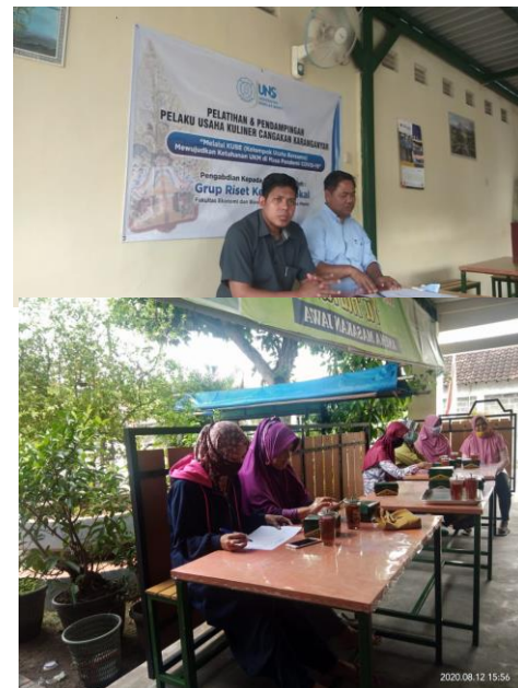
Gambar 1. Pelatihan Penguatan Kelembagaan & Kewirausahaan

Pelatihan disampaikan oleh Tim Pengabdian dengan dibantu oleh mahasiswa dan diikuti oleh UMKM kuliner di Cangakan, Karanganyar.