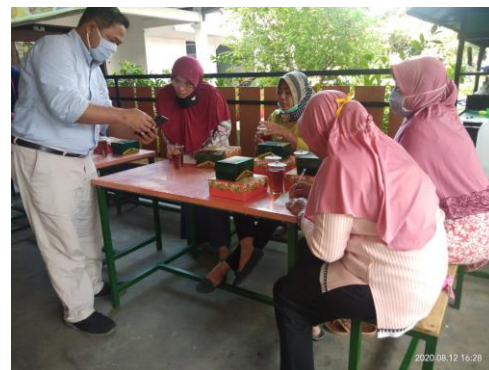
Gambar 3. Pendampingan Pembentukan Kelompok Usaha Bersama

Setelah mendapatkan materi penguatan kelembagaan, peserta pelatihan yang juga pelaku usaha kuliner di Cangakan, Karanganyar menjadi termotivasi untuk membentuk kelompok usaha bersama. Pembentukan kelompok usaha bersama didampingi oleh Tim Pengabdian. Sebagai permulaan, peserta pelatihan dibagi ke dalam beberapa kelompok agar memudahkan koordinasi antara anggota dan efisiensi kelompok. Dalam pendampingan pembentukan kelompok usaha bersama juga dijelaskan mengenai kiat-kiat dalam membentuk dan memelihara kelompok agar tetap terjaga kebersamaannya dan memberikan manfaat ke semua anggota kelompok.