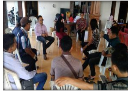
Gambar 8. Pelatihan Guiding dan pembuatan Story Telling