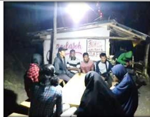
Gambar.12 Diskusi malam untuk pembuatan jalur geotrack