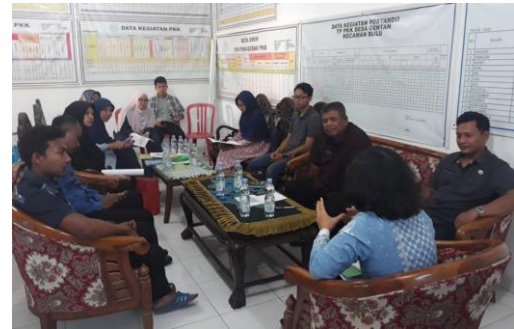
Gambar. 2 Diskusi Tim Pengabdian dengan Mitra Metode penyuluhan diterapkan dalam kegiatan manajemen Sumber Daya Manusia, meliputi pelatihan pelayanan pariwisata, pelatihan guiding, dan pelatihan pembuatan story telling . Sementara metode pendampingan diterapkan dalam pembuatan paket wisata, pembuatan makanan khas desa Gentan, penataan kawasan atraksi wisata, pembuatan sarana promosi wisata.