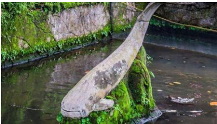
Gambar 5. Sendang lele