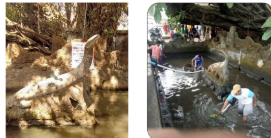
Gambar 14. Kondisi Sendang Lele sebelum dan sesudah pengabdian