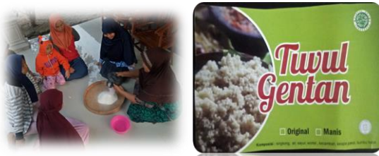
Gambar 15. Pelatihan pembuatan tiwul.