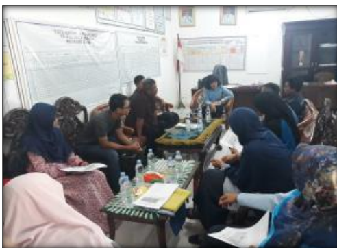
Gambar 1. Rapat Koordinasi untuk memulai pengabdian

Metode serap aspirasi digunakan dalam kegiatan sarasehan bersama masyarakat Desa Gentan. Kegiatan tersebut bertujuan menjaring opini masyarakat terkait rencana pengembangan kawasan wisata di Desa Gentan. Kegiatan yang dihadiri oleh seluruh perangkat desa, karang taruna, BABINSA, pedagang, pemilik rumah joglo, tetangga desa, dan PEMDA Sukoharjo ini berjalan dengan lancar dan menghasilkan kesimpulan bahwa seluruh pihak mendukung ide pengembangan wisata di Desa Gentan.