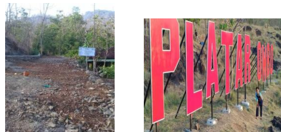
Gambar. 13. Kondisi Platar Ombo Sebelum dan setelah pengabdian

d. Melakukan manajemen atraksi wisata, meliputi dibukanya lokasi wisata yang baru yaitu Platar Ombo dan Watu Abang, menata lokasi wisata (Platar Ombo, Sendang Lele dan Embung Pacinan), mengangkat makanan lokal sebagai ikon desa Gentan yang dikelola oleh Aosiasi Boga Citra Gentan dan membuat souvenir “Gentan Geopark Village” berupa kaos yang didesain oleh warga desa.