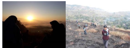
Gambar 7. Sunrise di Platar Ombo