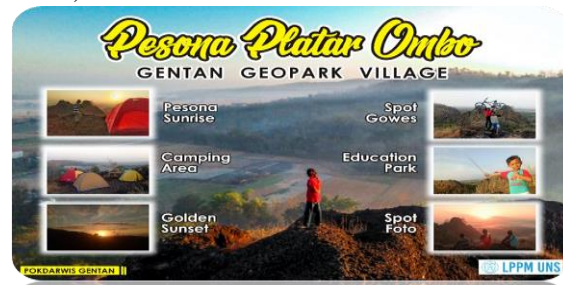
Gambar 9. . Paket wisata Pesona platar Ombo