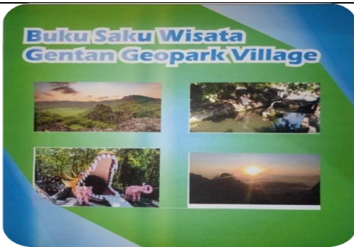
Gambar 10. Guide Book “Gentan Geopark Village”