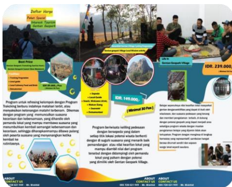
Gambar 11. Paket wisata Gentan Geopark Village

c. Pembuatan jalur geotrack. Selain akses jalan pendakian, perlu adanya papan peraturan atau SOP bagi wisatawan yang berkunjung ke Platar Ombo, karena medan yang cukup terjal, sering terjadi kebakaran lahan, dan upaya menjaga kelestarian alam. Tujuan lain dari optimalisasi Platar Ombo adalah mengemas mitos yang beredar di masyarakat bahwa di atas bukit terdapat Ular Naga dan Kera penunggu, yang sering membuat masyarakat desa sering resah. Sehingga terkadang muncul tindakan-tindakan warga yang tidak terduga, misalnya membakar lahan dengan dalih ingin membunuh Ular penunggu yang mereka jumpai.