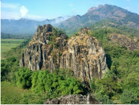
Gambar 4. Gunung Sepikul dan Segendong