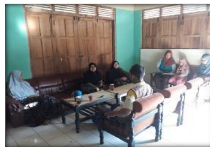
Gambar.3. Wawancara dengan masyarakat untuk menggali folklore