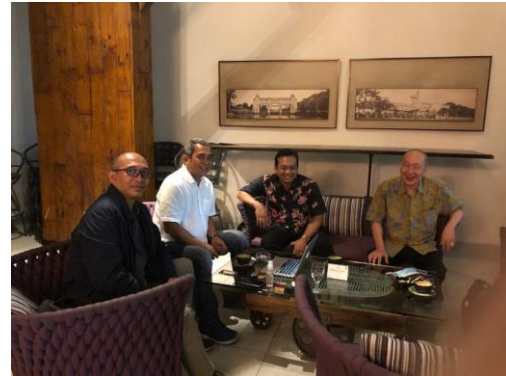
Gambar 3. Pendampingan Pelaksanaan Legal Due Diligence Dengan Klien Mitra

Sampai dengan akhir bulan Agustus 2020, kantor hukum mitra telah memberikan 2 (dua) bentuk layanan jasa hukum berupa legal due diligence terhadap transaksi pengambilalihan usaha yang dilakukan oleh kliennya. Kegiatan tersebut memberikan pengalaman pada kantor hukum mitra untuk menanggapi layanan jasa hukum non litigasi . Dengan demikian maka perencanaan untuk melakukan diversifikasi layanan jasa hukum telah dapat direalisasikan pada tahun pertama sejak pelatihan dan pendampingan diberikan.