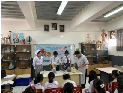
Gambar 4. Pelaksanaan Kegiatan PkM

Workshop dipimpin oleh tim yang dimulai dengan pembagian kelompok dan bahan, penjelasan tentang manfaat buah dan sayur serta sorbet , dan kemudian pembuatan sorbet oleh para siswa. Sorbet yang diajarkan kepada siswa adalah sorbet mangga dan tomat. Kegiatan ini diikuti oleh 30 orang siswa.