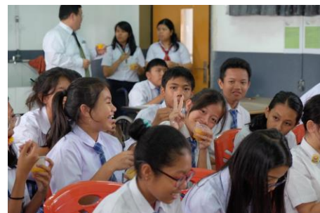
Gambar 5. Siswa Mencoba Hasil Kreasi Sorbet

Berdasarkan hasil di atas menunjukkan bahwa siswa sudah memahami materi yang sudah diberikan, dan mampu meningkatkan pengetahuan tentang sorbet serta menumbuhkan kreasi tentang sorbet . Sedangkan fasilitator dinilai mampu untuk menyampaikan materi dan memiliki pengetahuan yang luas tentang produk.