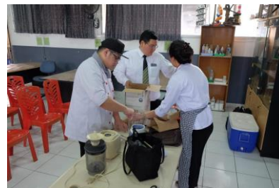
Gambar 3. Persiapan Kegiatan PkM

Kegiatan Pengabdian kepada Masyarakat (PKM) di Sekolah Lentera Harapan (SLH) Curug Tangerang, dan tim melakukan persiapan. Kegiatan diawali dengan registrasi dan dilanjutkan dengan pembukaan.