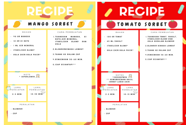
Gambar 2. Desain Resep Sorbet

Resep yang telah diujikan dibuat dengan desain yang menarik agar siswa semangat dalam mengikuti workshop .