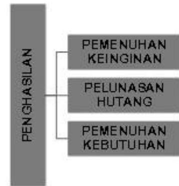
Gambar 2. Pengalokasian Penghasilan