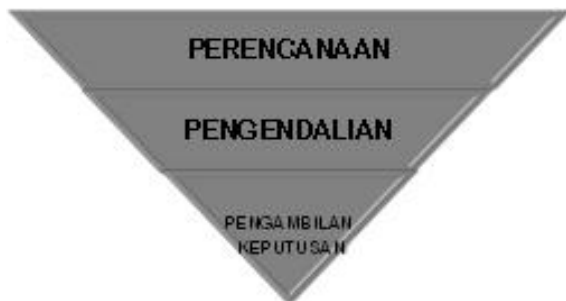
Gambar 1. Dasar Umum Mengelola Keuangan

Setelah empat sesi pemaparan kegiatan dilaksanakan maka dilakukan penyerahan plakat dari UPH kepada Pengurus kaum wanita GKI Gading Serpong disertai acara foto bersama serta acara ditutup dengan makan siang bersama.