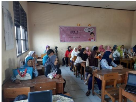
Gambar 7. Sesi Materi

bersekolah sementara anaknya bekerja mencari nafkah. Walau sudah berumur, tapi ibu ini tetap berusaha agar mengerti tentang hp dan informasinya agar bisa mendampingi cucunya dengan informasi yang benar. Kisah-kisah serupa banyak ditemui, sehingga memang penting literasi media diberikan kepada ibu-ibu agar mereka ada kebanggaan, kepercayaan diri, dan kemampuan untuk mengajari dan mendampingi anak.