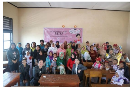
Gambar 8. Foto bersama seluruh peserta

juga mengerti bahwa tidak setiap pesan atau informasi yang mereka dapatkan dipercaya 100% kebenarannya. Mereka harus membaca dengan cermat, dan menguji kembali salah satunya lewat media massa. Benarkah informasi tersebut, apakah media massa sudah memberitakannya. Kalau belum berarti tidak terbukti kebenarannya. Setiap peserta juga memahami bahwa ada dampak buruk saat menyebarkan informasi atau berita hoax . Salah satunya bisa memicu konflik bahkan konflik dengan tetangga dekat. Peserta juga mengerti bahwa jika tidak ada kepentingannya untuk apa menyebarkan informasi yang mereka pun tidak pahami kepada orang lain. Jika mereka paham akan informasi tersebut atau pesan yang diterima dan sudah dibaca dicek kebenarannya maka mereka baru akan menyebarkannya.