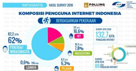
Gambar 2. Data Komposisi Pengguna Internet di Indonesia