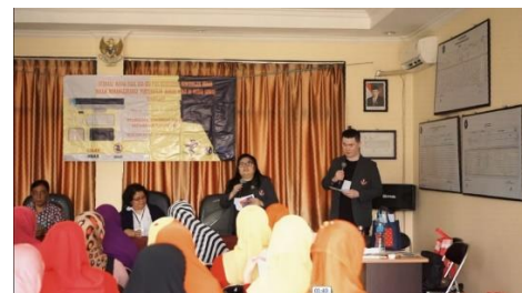
Gambar 4. Sesi tanya jawab

Di hari pelaksanaan PKM, setelah semua peserta hadir, acara diawali dengan doa dan pidato sambutan dari Pak Lurah. Sesudah nya sesi materi yang diawali dengan definisi dari media sosial, bentuk-bentuk media sosial, dan langsung mengarah utamanya adalah Whatsapp. Para peserta mencatat dan mendengarkan materi dengan cermat.