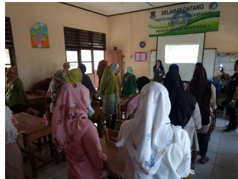
Gambar 6. Acara pembukaan dengan iringan lagu untuk menyemangati peserta.

Acara dibuka dengan doa dan sambutan dari pihak sekolah SDN 1 Mauk. Dan sesi dimulai dengan materi singkat tentang bahaya berita hoax dan bagaimana cara menghadapinya. Sesi materi dibuat lebih singkat untuk memperpanjang waktu sesi praktek. Sesi praktek dibuat lebih lama agar bisa mengajari ibu-ibu menggunakan smartphone mereka juga menguji berita hoax tersebut. Pada sesi praktek ini juga terbuka kesempatan bagi para peserta untuk bertanya dan membagikan pengalamannya dalam berhadapan dengan teknologi.