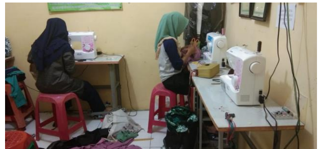
Gambar 6. Peserta Pelatihan Bantuan Program Pelatihan dan Peralatan Pelatihan Kerja

Dengan anggaran dan waktu yang terbatas sulit bagi lembaga untuk mencapai kompetensi lulusan yang diharapkan siap masuk ke DUDI, para lulusan biasanya harus memperdalam atau ikut magang terlebih dahulu. Untuk mengikuti uji kompetensi di bidang kejuruan menjahit minimal harus mencapai level 2 yang biasanya harus menempuh pelatihan selama 250 JP.