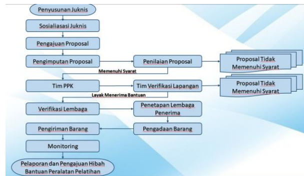
Gambar 4. Mekanisme dan Koordinasi Pemberian Bantuan Peralatan Pelatihan Kerja.

Untuk melaksanakan pelatihan kerja LPKS harus memiliki sarana dan prasarana pelatihan kerja yang memadai sesuai dengan kebutuhan industri, sehingga LPKS dapat menjamin mutu lulusan pelatihan kerja yang kompeten dalam bidangnya dan dapat diserap oleh dunia industri. Salah satu bentuk kebijakan yang dilakukan oleh Kementerian Ketenagakerjaan yaitu dengan memberikan bantuan peralatan pelatihan kerja bagi LPKS. Pemberian bantuan ini dilakukan dengan berbagai tahapan dan mekanisme seperti terlihat pada gambar 4.