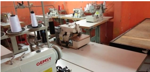
Gambar 8. Bantuan Peralatan Berupa Mensin Jahit High Speed Untuk Kejuruan Menjahit Garment