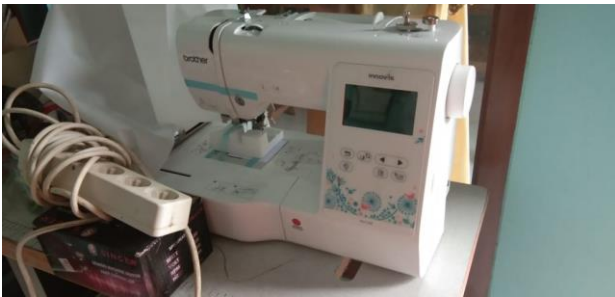
Gambar 7. Bantuan Peralatan Berupa Mensin Jahit Portable Untuk Kejuruan Menjahit Tata Busana

Kesulitan terjadi bila terjadi masalah yang cukup serius pada mesin jahit yang moderen bila lokasi LPKS jauh dari tempat service resmi, karena sulit untuk bisa dilakukan perbaikan tanpa menggunakan teknisi yang benar-benar memahami karakteristik mesin.