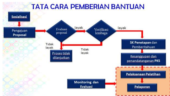
Gambar 2. Mekanisme Pemberian Bantuan Program Pelatihan.

Jenis Bantuan Program Pelatihan yang diberikan kepada LPKS meliputi bantuan keuangan sebesar Rp.30.000.000 untuk melaksanakan pelatihan kepada 20 orang peserta selama 100 jp dalam waktu 13 hari . Adapun mekanisme pemberian bantuan dapat dilihat pada gambar 2.