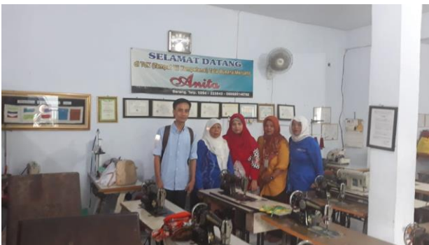
Gambar 6. Salah Satu LPKS di Kota Serang Menyalurkan Lulusan Ke Perusahaan Konveksi

Sebagian perusahaan konveksi memberi fasilitas bantuan mesin pada masyarakat berupa mesin jahit sebanyak 10 – 20 unit sehingga bisa mengerjakan di rumah. Adapun LPKS yang berada di sekitar industri garment dapat menyalurkan lulusannya dengan mudah ke industri bahkan industri garment sudah memesan lulusan sebelum selesai pelaksanaan pelatihan.