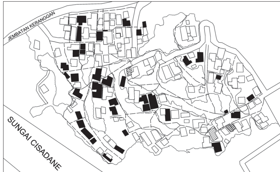
Gambar III.3 Peta Tracing Industri Rumah Tangga Keranggan