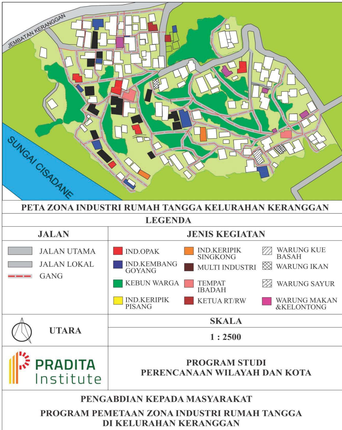
Gambar IV.1 Peta Zona Industri Rumah Tangga Kelurahan Keranggan