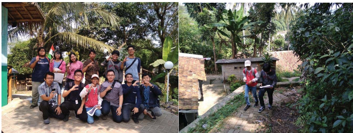
Gambar III.4 Proses Survei Ditemani oleh Perangkat Desa

Peta tracing industri rumah tangga yang telah tercetak digunakan oleh mahasiswa dan tim dosen peneliti melakukan survei ke rumah-rumah yang memiliki industri rumah tangga. Mahasiswa dan tim dosen peneliti mendatangi satu per satu rumah yang memiliki industri rumah tangga dan melakukan pendataan mengenai jenis industri rumah tangga yang dimiliki masyarakat.