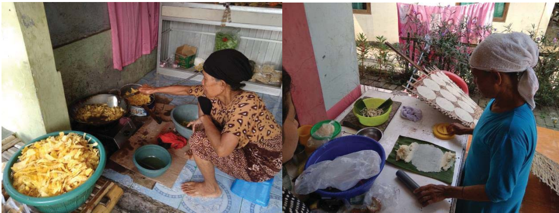
Gambar III.5 Industri Rumah Tangga Keripik Singkong dan Opak di Keranggan

Dalam proses tersebut, ditemukan bahwa industri rumah tangga yang dimiliki masyarakat semuanya merupakan industri makanan ringan. Industri makanan ringan tersebut diantaranya didominasi oleh industri opak, kemudian diikuti dengan industri keripik singkong, keripik pisang, kembang goyang, akar kelapa, dan enye.