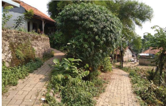
Gambar III.1 Jalan-jalan sempit dan berliku di RT 12 dan 13 Keranggan

Kunjungan pertama dilakukan untuk melihat orientasi kondisi wilayah yang ada di Kelurahan Keranggan. Hasil dari kunjungan pertama yang telah dilakukan, mengerecut pada persoalan kerumitan akses dan sebaran industri rumah tangga yang terpencar.