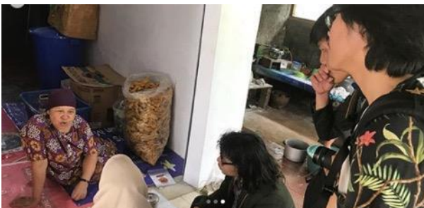
Gambar 4. Survei para mahasiswa/i di Kelurahan Keranggan.

Sehingga melalui tahap survei ini, kembali tim penulis dapat menyimpulkan bahwa pentingnya sebuah komunikasi bahkan non-formal dapat membangun ikatan emosional yang mempermudah bagi desainer komunikasi visual untuk berkarya lebih matang dan lebih sesuai dengan kebutuhan dan keadaan yang riil.