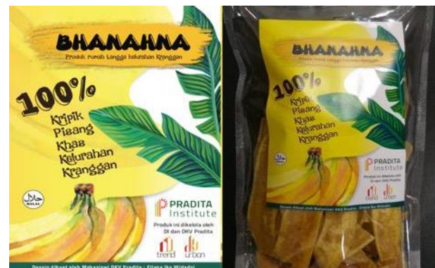
Gambar 8. Pendekatan desain kemasan keripik pisang.

Misalnya dalam membahas produk keripik singkong; Ibu Supiyah menceritakan anaknya yang menyukai singkong sejak kecil; laksana anak singkong, untuk itu desain mengacu pada komik dengan maskot chef kecil yang berkumis.