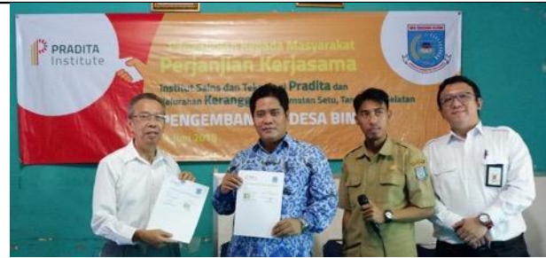
Gambar 1. MOU Pradita Institut dengan Kelurahan Keranggan.

Pada tahap ini tim penulis melakukan kelanjutan dari perjanjian antara Institut Sains dan Teknologi Pradita dengan Kelurahan Keranggan untuk membantu produksi ibu rumah tangga, khususnya untuk produk makanan ringan. Dalam hal ini program studi Desain Komunikasi Visual melakukan program pembuatan kemasan ulang dan disply produk makanan ringan untuk meningkatkan penjualan dengan pendekatan imaji strata ekonomi yang lebih tinggi.