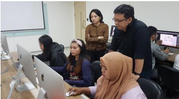
Gambar 10. Asistensi kemasan ulang produk makanan ringan.

Pada tahap ini tim penulis melakukan pemilihan dari karya terbaik. Terdapat 2 (dua) sesi dalam proses pemilihan ini, antara lain dengan dosen pengampu mata kuliah Advertising, yang berupa asistensi agar semua variasi desain kemasan ulang dapat dipaparkan pada pemilihan selanjutnya.