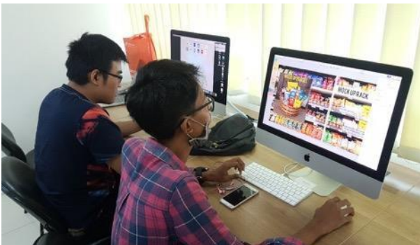
Gambar 6. Melakukan desain kemasan ulang produk.

Pada tahap ini tim penulis melakukan penjahitan dengan mata kuliah advertising, dimana terdapat salah satu dosen advertising juga merupakan tim penulis. Dari hal ini didapati bahwa pendekatan hasil survei dapat digunakan dengan maksimal dengan memutar kembali video dokumentasi. Sehingga detail dari nusa wawancara survey kembali terulang khususnya secara emosi.