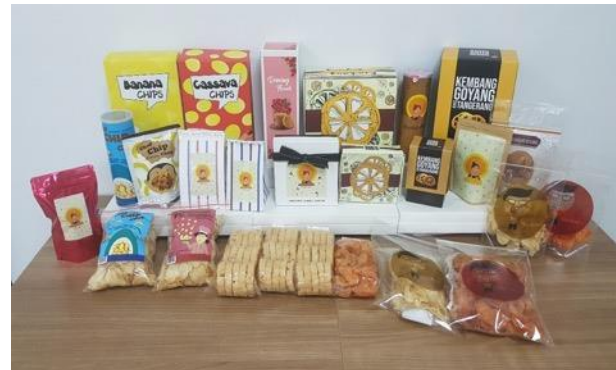
Gambar 12. Hasil variasi desain kemasan ulang produk.

Setelah selesai pemilihan pertama ini, tim penulis melakukan proses pemilihan berikutnya dengan kepala program studi dan wakil rektor untuk mendapatkan pilihan final dan proses revisi terakhir sebelum desain siap masuk produksi secara masal.