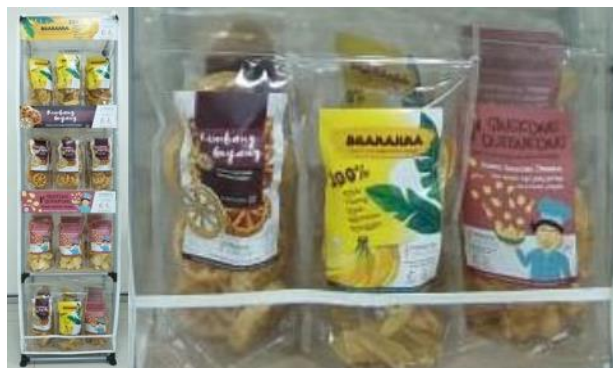
Gambar 14. Detail display produk untuk kemasan ulang.

Salah satunya adalah pertimbangan untuk menghitung harga model dengan margin yang masih laku dijual, hal ini dilakukan tim penulis dengan