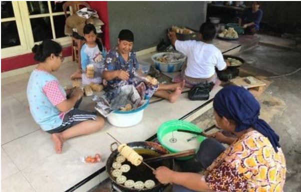
Gambar 2. Survei suasana memasak di Kelurahan Keranggan.

Selain itu juga para mahasiswa/i banyak yang melakukan perbincangan dengan para ibu rumah tangga Kelurahan Keranggan sehingga terjalin komunikasi yang lebih dalam daripada sekedar komunikasi antara penjual dan pembeli.