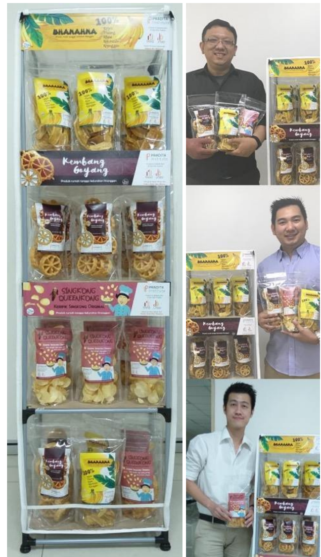
Gambar 15. Hasil display produk untuk kemasan ulang produk.

Sehingga tim penulis menyimpulkan bahwa rak untuk mendisplay ulang guna meningkatkan penjualan ini; dapat dipakai dengan baik, namun perlu ada penjagaan dari pihak penjual karena rak tidak dapat di kunci, walau dibutuhkan waktu untuk membuka atau menutup karena menggunakan resliting yang panjang.