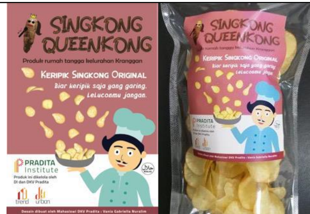
Gambar 7. Pendekatan desain kemasan keripik singkong.

Dari hasil dan progres pembuatan desain kemasan luang ini tim penulis menyimpulkan bahwa proses survei menentukan hasil desain yang dibuat. Khususnya dalam menangkap emosi produsen, para mahasiswa/i menangkap karakter apa yang dibawakan oleh ibu rumah tangga terkait.