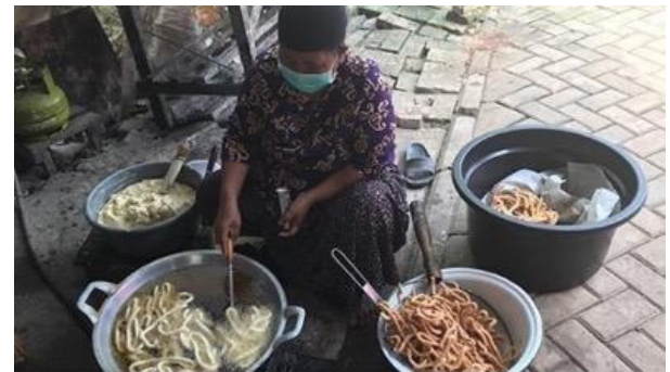
Gambar 5. Salah satu produsen di Kelurahan Keranggan.

Pada tahap ini tim penulis melakukan pendataan hasil survei yang meliputi: data ibu rumah tangga mana yang memiliki tingkat kebersihan yang baik, data ibu rumah tangga mana yang memiliki banyak variasi pada produk makanan ringan yang dihasilkan, serta kemasan apa yang dipakai oleh produsen sehingga menentukan harga jual dan kebutuhan kemasan ulang.