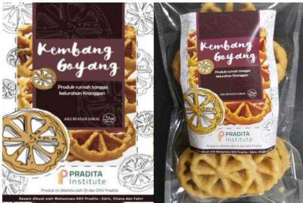
Gambar 9. Pendekatan desain kemasan kembang goyang.

Semua desain kemasan ini diberikan nama mahasiswa/i sebagai desainernya. Hal ini menjadi portofolio bagi mahasiswa/i yang hasil tugasnya benar-benar dapat terimplementasi dengan produk makanan ringan Kelurahan Keranggan secara riil.