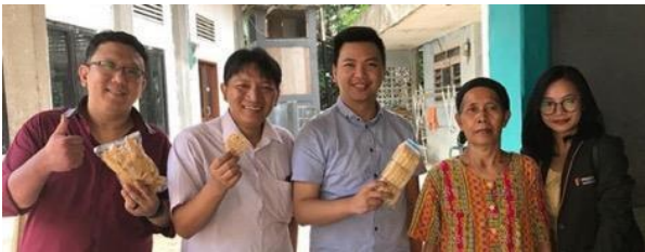
Gambar 3. Survei tim dosen di Kelurahan Keranggan.

Selain itu juga para mahasiswa/i banyak yang melakukan perbincangan dengan para ibu rumah tangga Kelurahan Keranggan sehingga terjalin komunikasi yang lebih dalam daripada sekedar komunikasi antara penjual dan pembeli.