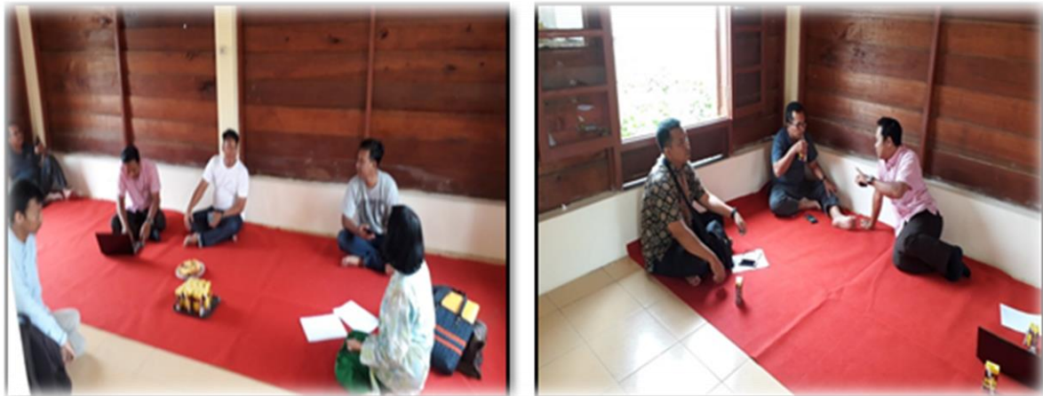
Gambar1.Sosialisasi dan koordinasi kegiatan oleh Tim dan pengurus Kube Griya Kain Tuan Kentang

Tahap Persiapan Tim pelaksana yang terdiri dari 4 orang Dosen dan 4 orang mahasiswa , dibagi dan diberi tanggung