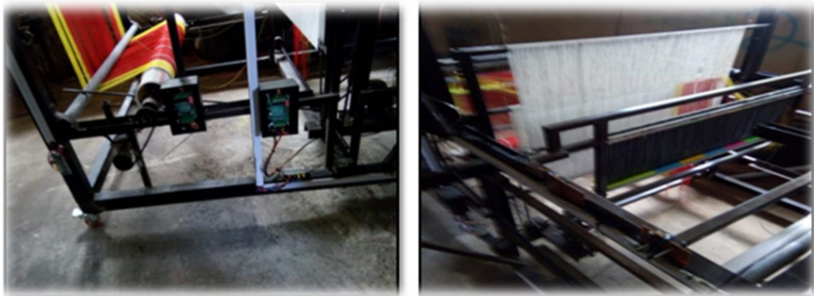
Gambar 3. Mesin Tenun Semi Otomatisasi