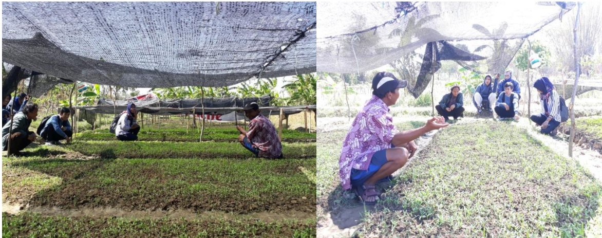
Penanaman Benih Cabe