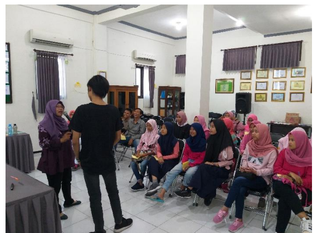
Gambar 1. (Pelatihan character building pertemuan kedua)