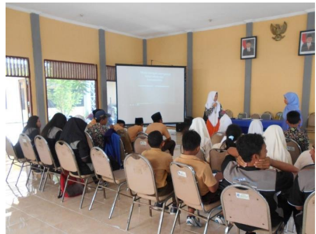
Gambar 1. (Pelatihan character building pertemuan pertama)

terkait cara-cara tersebut. Setelah pemberian pelatihan kader posyandu remaja diberi posttest untuk melihat apakah ada peningkatan terhadap pengetahuan kader posyandu remaja berkaitan dengan Character Building agar dapat melihat sejauh mana kader posyandu remaja memperoleh manfaat dari pelatihan, apakah sudah dapat memahami materi dan kemudian mengaplikasikannya baik untuk diri sendiri ataupun untuk bisa dibagikan pemahaman tersebut terhadap teman-teman mereka.