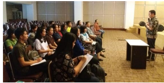
Gambar 4. Peluncuran awal program

Ketika semua persiapan selesai, tim PkM mempersiapkan acara pembukaan program dan sesi pertama tatap muka dengan peserta program. Gambar 4 berikut menunjukkan kegiatan peluncuran awal program yang dihadiri seluruh peserta.