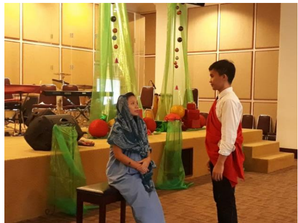
Gambar 5. Penampilan Peserta PkM

Pada saat tes lisan, terutama saat ujian akhir semester, peserta didik terlihat cukup percaya diri dalam bercakap-cakap dalam bahasa Inggris. Mereka yang awalnya masih sangat malu berbicara dalam bahasa Inggris, bahkan dengan teman sekelas mereka, kini mereka memperlihatkan rasa percaya diri yang lebih tinggi dalam berbicara menggunakan bahasa Inggris. Gambar 5 berikut menunjukkan penampilan peserta didik di depan teman-temannya.