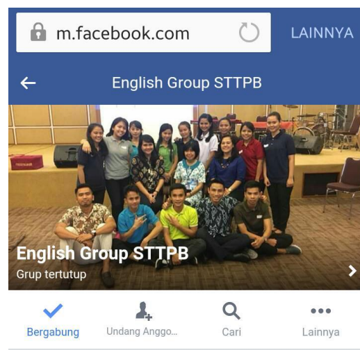
Gambar 2. Platform Facebook

Setelah materi pembelajaran siap, persiapan yang dilakukan oleh tim PkM adalah mempersiapkan platform pembelajaran yang digunakan sebagai media pembelajaran selain blog yang telah disebutkan di atas. Platform lain yang digunakan dalam PkM ini adalah Facebook dan Whatsapp Group. Gambar 2 berikut menunjukkan platform berbasis teknologi berupa Facebook yang digunakan dalam kegiatan PkM yang menggunakan metode blended learning ini.