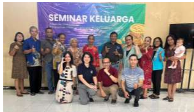
Gambar 1. Dokumentasi Narasumber dan Peserta Kegiatan PkM Financial Stewardship PK3I

Kegiatan PkM PK3I dilaksanakan secara tatap muka ( onsite ) dengan pendekatan edukatif melalui seminar dan partisipatif mengerjakan lembar simulasi dengan tujuan meningkatkan pemahaman dan keterampilan peserta PkM dalam pengelolaan keuangan keluarga mengacu pada financial stewardship berbasis WKA. Adapun tahapan kegiatan diawali dengan persiapan materi dan perangkat kegiatan, meliputi penyusunan modul pelatihan, slide PPT, serta lembar simulasi PK3I sebagai media praktik pengelolaan keuangan keluarga yang aplikatif. Setelah materi dan perangkat kegiatan siap digunakan, maka kegiatan PkM dilaksanakan pada hari Minggu, 16 Maret 2025, pukul 09.00–10.30 WIB, dengan jumlah peserta sebanyak 15 orang yang merupakan mitra binaan dari Yayasan Amarta Kasih Indonesia, Sukoharjo, dapat dilihat pada Gambar 1.