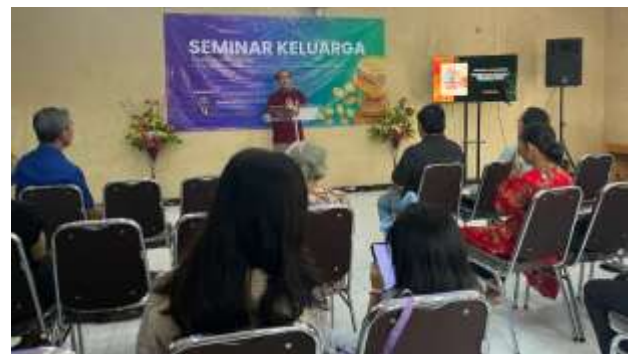
Gambar 3. Sesi Seminar Financial Stewardship PK3I di Yayasan Amarta Kasih Indonesia

Pemahaman yang tepat terhadap makna dan fungsi uang dapat memotivasi setiap peserta menggunakan uang (penghasilan) yang diperoleh dari pekerjaan mereka, baik yang diperoleh secara harian, mingguan, ataupun bulanan. Lebih lanjut, pengetahuan yang memadai terkait PK3I akan berdampak signifikan terhadap kemampuan dalam menentukan skala prioritas kebutuhan dan merumuskan alternatif penanganan risiko, serta melakukan evaluasi dan monitoring secara berkala terkait pengalokasian uang yang dimiliki untuk pemenuhan kebutuhan hidup dan hal-hal yang bermanfaat lainnya. Hal tersebut menunjukkan bahwa mengelola keuangan bertujuan untuk meminimalkan potensi risiko dalam pengambilan keputusan terkait alokasi pendapatan dalam realitas sehari-hari (Sari & Irdhayanti, 2022). Adapun sesi seminar financial stewardship PK3I dapat dilihat pada Gambar 3.