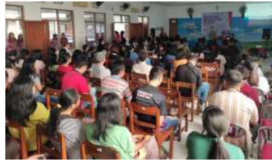
Gambar 3. Peserta pembinaan orang tua murid

Orang tua perlu selalu menjadikan relasi Kristus dengan jemaat sebagai dasar. Yesus Kristus merelakan diri-Nya tersalib untuk memulihkan relasi dengan jemaat sehingga terjadi perdamaian antara Allah dan manusia berdosa (Han, 2019). Dengan prinsip iman kristiani yang esensial ini maka setiap konflik yang terjadi pada orang tua harus diselesaikan dengan dasar saling mengasihi demi pemulihan relasi dan terciptanya damai sejahtera dalam keluarga.