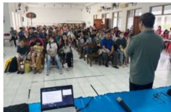
Gambar 2. Kegiatan pembinaan orang tua murid

Anak bukan hanya sekedar pribadi yang dikehendaki keberadaannya oleh orang tua, tetapi merupakan pribadi yang unik dalam dirinya sendiri yang diciptakan Allah sebagai gambar dan rupa-Nya (Han, 2025). Orang tua memiliki anak utamanya bukan untuk meneruskan keturunan maupun marga keluarga, namun sebagai wujud nyata ketaatan akan perintah Tuhan (Kej. 1:28). Anak merupakan anugerah yang Tuhan percayakan untuk setiap orang tua di dalam keluarga. Keluarga harus menjadi sarana pendidikan yang paling utama bagi anak. Orang tua selalu menjadi panutan bagi anak dalam hal iman dan perilaku.