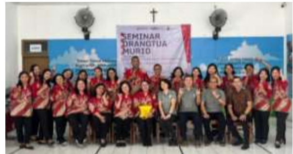
Gambar 4. Tim PkM beserta mitra dan sekolah

Beragam permasalahan dan keresahan tersebut menunjukkan bahwa pembinaan orang tua tidak dapat ditangani hanya dalam satu kali pertemuan, melainkan membutuhkan program yang berkelanjutan dan terarah. Yayasan AKSI sebagai mitra pelayanan pendidikan Kristen menyadari pentingnya pendampingan jangka panjang dan melihat perlunya dukungan strategis dari FIP UPH untuk melanjutkan pembinaan dengan menjawab isu-isu prioritas secara bertahap.