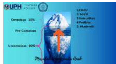
Gambar 4: Masalah psikologis siswa

Tiga tingkatan kesadaran Freud dapat menjadi acuan guru dalam memberikan pendampingan psikologis terhadap siswa-siswa SDDI. Setiap kondisi emosional, sosial, komunikasi, perilaku, dan akademik siswa yang terlihat pada tataran fenomena hanyalah 10% dari realita yang sebenarnya. Bahkan, menurut beberapa sumber seperti menyebutkan fenomena psikologis yang adalah 10% tersebut didorong oleh 90% pengalaman preconciuous dan unconciuous siswa (Novel, Sari & Suriani, 2017). Jika muncul fenomena masalah sikap pemberontakan terhadap otoritas, berbohong demi kesenangan diri, ketidak-jujuran dalam hal akademik, bullying terhadap sesama teman, maka hal itu didorong oleh 90% pengalaman kecewa, terluka, cemburu, malu, sedih, takut, cemas, dan frustrasi pada tingkat preconciuous dan unconciuous siswa (gambar 4).