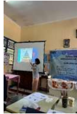
Gambar 2: Sesi 2 oleh Ibu Gandasari