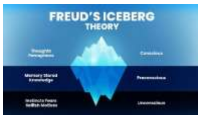
Gambar 3: Freud's ice-berg theory

Sigmund Freud adalah seorang ahli psikoanalisis dalam bidang psikologi asal Austria. Freud memberikan sumbangsih yang esensial dalam penelitian jiwa manusia dengan menyatakan bahwa jiwa manusia memiliki tiga tingkatan kesadaran: concious, preconciuous, dan unconciuous. Ketiga tingkatan ini kerap dikenal sebagai Freud's ice-berg theory (gambar 3).