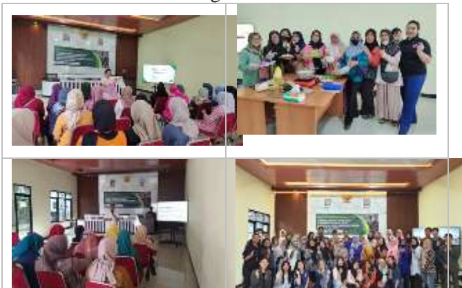
Gambar 1 Rekapitulasi Kegiatan

kualitas produk, keterampilan inovasi, serta kemampuan pemasaran digital para pelaku UMKM. Dengan menguasai strategi modifikasi produk dan strategi pemasaran yang tepat, UMKM diharapkan dapat bertahan dan berkembang di tengah tantangan pandemi dan persaingan pasar yang semakin ketat. Hal ini sejalan dengan upaya pemerintah yang mendorong digitalisasi UMKM agar dapat meningkatkan kesejahteraan pelaku usaha melalui pemanfaatan platform online dan media sosial sebagai sarana pemasaran utama (Hilmiana & Kirana, 2021; Nadya, dkk., 2024). Dalam membangun komunitas yang mandiri membutuhkan individu-individu yang mempunyai motivasi, dan pengetahuan yang cukup untuk membuat komunitas bertahan dan berkembang secara finansial.