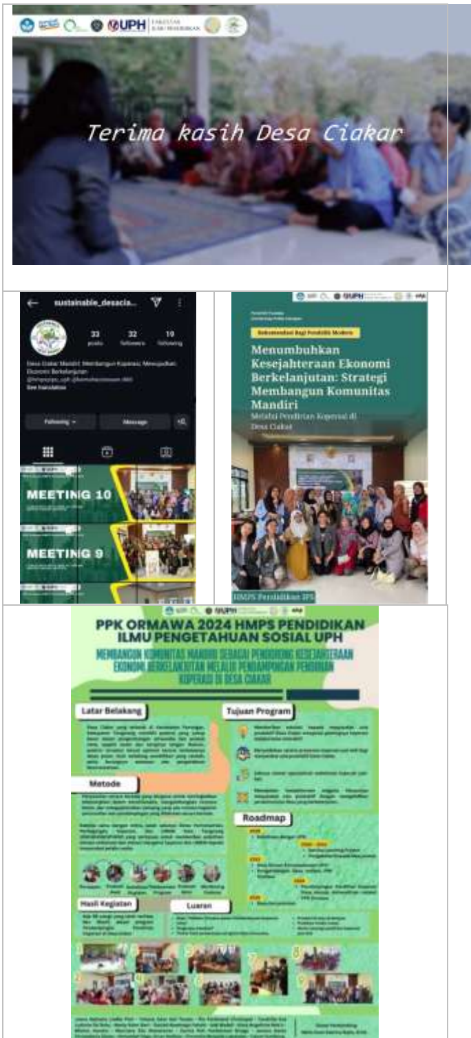
Gambar 3 Luaran