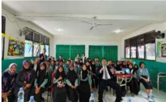
Tabel 2 Pelaksanaan Pelatihan Penulisan dan Pembacaan Pentigraf Tahap II

dan mengorganisasi para siswa yang telah menetapkan pilihan untuk mengikuti lokakarya Menulis Pentigraf dan lokakarya Membaca Pentigraf. Adapun foto yang dimaksud dapat terlihat pada gambar 1 di bawah ini.