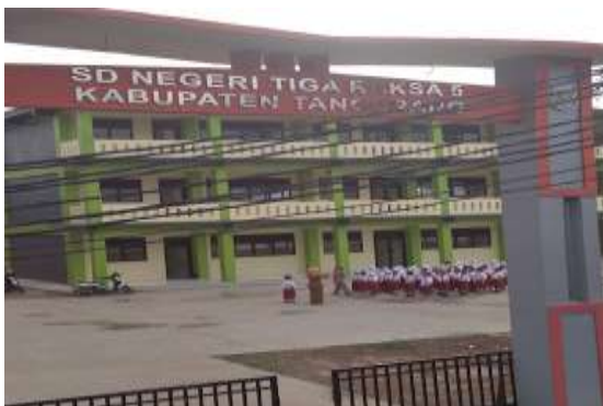
Gambar 1 Foto Mitra SDN 5 Tigaraksa

Berdasarkan beberapa pendapat tersebut, Tim PkM Bahasa Indonesia menemukan permasalahan tersebut dan menjadi hal yang serius dialami oleh salah satu mitra. Dengan demikian, Tim PkM Bahasa Indonesia melakukan studi pendahuluan untuk mengetahui analisis kebutuhan mitra. Mitra yang dimaksud adalah SDN 5 Tigaraksa yang beralamat di Perum Sudirman Indah Blok B, Tigaraksa, Kec. Tiga raksa, Kab. Tangerang, Prov. Banten. Mitra tersebut untuk saat ini masih menggunakan Kurikulum Merdeka dengan jumlah murid keseluruhan 617 orang. Sementara itu, jumlah guru ada sebanyak 23 orang (termasuk kepala sekolah). Selain itu, jumlah kelas sebanyak 16 ruangan dan jumlah siswa di setiap kelas antara 30-35 siswa.