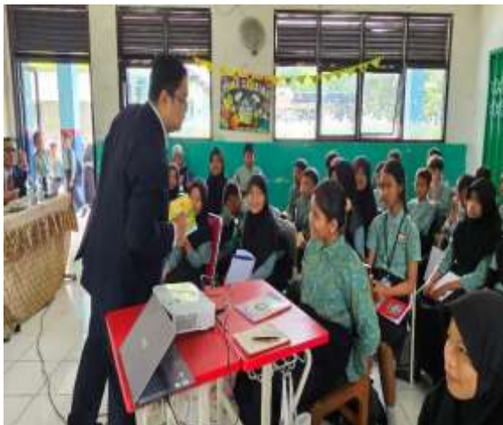
Gambar 4 Penjelasan konsep Pentigraf

Unsur Ci - pada penulisan cerpen berarti di dalam cerpen harus diberikan pengenalan tokoh. Artinya, siswa harus memperlihatkan bahwa di dalam cerpen yang hendak ditulis memunculkan tokoh yang akan diceritakan. Kemudian unsur Luk - pada penulisan cerpen berarti memunculkan konflik atau masalah yang diceritakan dalam pentigraf. Masalah yang dimaksud dapat berupa masalah sehari-hari yang pernah terjadi pada siswa-siswi. Selanjutnya, unsur Ba - pada penulisan cerpen berarti di dalam cerita harus ada solusi atau penyelesaian masalah yang disampaikan pada akhir cerita.