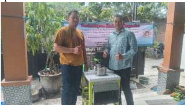
Gambar Penyerahan TTTG kepada Mitra

Pelatihan ini bertujuan agar mitra mampu mengelola keuangan dengan baik dan mampu memisahkan keuangan usaha dan keuangan keluarga. Materi yang di berikan antara lain ; perencanaan keuangan, penganggaran, penggajian, pencatatan transaksi dan pembukuan sederhana. Dari pelatihan dan pendampingan pembuatan laporan keuangan tersebut, mitra di berikan pengetahuan tentang cara mendapatkan dan mengelola pendanaan yang dii dapat dari bank atau lembaga keuangan lainnya, dimana laporan yang baik akan mempengaruhi bank dalam memberikan keputusan pendanaan melalui skema kredit usaha mikro. Dalam pelatihan ini juga di kenalkan juga aplikasi akuntansi berbasis android.