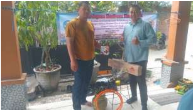
Gambar Peralatan kompor jos dan wajan besar.