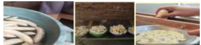
Gambar 3. Proses perajangan dan perendaman

Proses produksi pembuatan keripik pisang, terdapat beberapa tahapan dalam proses produksinya. Berikut adalah tahapan-tahapan umum dalam proses produksi pembuatan keripik pisang, Pertama, Persiapan Bahan Baku dan seleksi bahan, pisang yang digunakan biasanya adalah pisang kepok atau pisang sobo yang di peroleh dari petani pisang di sekitar Menganti. Dalam satu tandan terdapat 8-10 sisir pisang. Berat persisir sekitar 0,7 – 1,1 kg dengan jumlah buah persisir rata – rata 12 buah. Dari 1,1 kg pisang segar di peroleh berat setelah di kupas sekitar 0,7 kg dan menghasilkan 0,4 kg keripik pisang. Bahan lain yang diperlukan antara lain minyak goreng, gula pasir, dan garam halus.