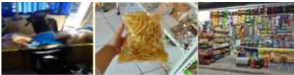
Gambar 6. Proses pemasaran dan pengiriman

Tahap selanjutnya adalah pengemasan dan pelabelan, pengemasan terkendala masih menggunakan plastik tipis dan label kemasan yang kurang menarik serta terkendala yang dihadapi sampai tahap ini adalah mitra sering mengeluh sakit pinggang setelah bekerja karena duduk di lantai. Pekerja juga menggunakan tangan langsung tanpa sarung tangan, hal ini menyebabkan produk tidak higienis.