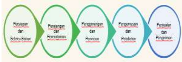
Gambar 1. Diagram Alur Produksi

Budi Sutiawan sudah lebih dari 4 tahun. Awalnya usaha ini merupakan usaha sampingan di rumah untuk menambah penghasilan keluarga namun seiring dengan waktu usaha ini berkembang dengan pesat, permintaan keripik pisang terus meningkat, sehingga diperlukan perluasan usaha. Proses produksi mitra cukup sederhana, digambarkan sebagai berikut :