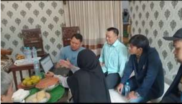
Gambar Pelatihan dan pendampingan pembuatan logo

produk, slogan, komposisi, berat bersih, tanggal kadaluarsa, alamat dan nomor telepon mitra.