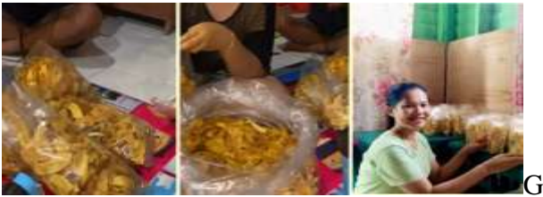
Gambar 5. Proses pengemasan dan pelabelan

Tahap selanjutnya adalah pengemasan dan pelabelan, pengemasan terkendala masih menggunakan plastik tipis dan label kemasan yang kurang menarik serta terkendala yang dihadapi sampai tahap ini adalah mitra sering mengeluh sakit pinggang setelah bekerja karena duduk di lantai. Pekerja juga menggunakan tangan langsung tanpa sarung tangan, hal ini menyebabkan produk tidak higienis.