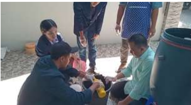
Gambar Peralatan tong komposter

Selama ini mitra membuang sampah buah, kulit dan batang pisang langsung ke tempat sampah, hal ini bisa menimbulkan bau tidak sedap dan menambah volume sampah organik pada tempat pembuangan sampah. Oleh karena itu Tim memberikan tong komposter untuk mengolah limbah sampah organik mitra, agar dapat memberikan manfaat pada lingkungan sekitar. Dari tong komposter tersebut, di hasilkan pupuk padat dan pupuk cair, dapat di gunakan untuk menyuburkan tanaman masyarakat sekitarnya.