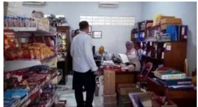
Gambar Kemitraan dengan Koperasi

Permintaan keripik pisang cukup tinggi namun pada momen – momen tertentu saja, sehingga pemasaran online sangat di butuhkan. Pelatihan pemasaran offline dan online di berikan untuk memberikan pengetahuan kepada mitra bagaimana mendapatkan pelanggan baru, cara komunikasi yang efektif dengan pelanggan, negosiasi dan sikap ramah(8). Mitra di berikan pendampingan dan kesempatan melaksanakan materi ini setiap minggunya. Tim pelaksana juga menjalin kerjasama dengan Koperasi Guru, Dosen dan Karyawan Wijaya Putra untuk penjualan mitra di toko milik koperasi.