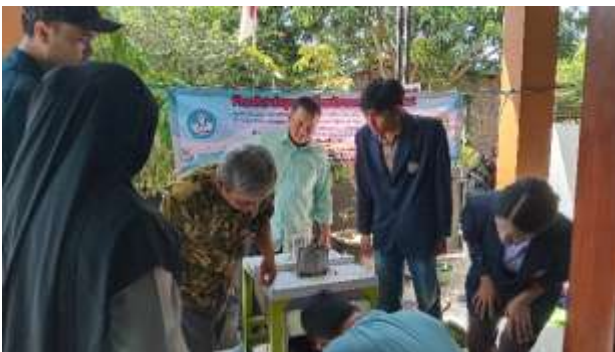
Gambar Diseminasi TTG Keripik Pisang

Diseminasi TTG Keripik Pisang di mulai melalui perancangan TTG. Rancangan TTG ini sudah tersedia sebelumnya oleh Agus Dharmawan, dkk(5) dan Aristyanto, dkk (6) namun dikarenakan kurang luasnya ruangan dan lokasi yang tidak memungkinkan, tim pelaksana mendesain ulang dengan cara kerja sedikit berbeda dan dengan ukuran yang lebih ringkas namun tetap ergonomis. Desain ini kemudian diserahkan kepada pengembang TTG selaku rekanan. TTG Keripik Pisang menggunakan bahan stainless stell yang aman untuk makanan (foodgrade), dan memiliki ketahanan panas yang sama dengan baja. Hal ini penting agar kualitas rasa keripik pisang yang dihasilkan sama dengan sebelumnya. TTG ini memiliki dimensi 85x50x95 cm dengan kapasitas 20 - 25 kg/jam hasil rajang menggunakan daya listrik 350 watt. Dengan menggunakan TTG ini kapasitas produksi akan meningkat hingga 4 kali lipat di mana sebelumnya menggunakan dengan manual.