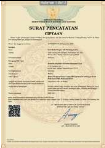
Gambar 13. Bukti Sertifikat HAKI Model Eksplorasi Bakat untuk Meningkatkan Kematangan Karir pada Anak Binaan