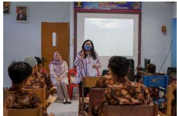
Gambar 8. Pelaksanaan Psikotes Minat dan Bakat di LPKA Kelas I Medan

Pelaksanaan penelusuran minat dan bakat LPKA Kelas 1 Medan dilaksanakan 8-9 September 2023. Pada kegiatan ini, anak binaan mendapatkan kesempatan untuk menjalani pemeriksaan minat dan bakat menggunakan sejumlah alat tes psikologi. Kegiatan dilaksanakan sebanyak dua gelombang disebabkan oleh keterbatasan ruangan yang memadai untuk pelaksanaan psikotes di LPKA Kelas I Medan.