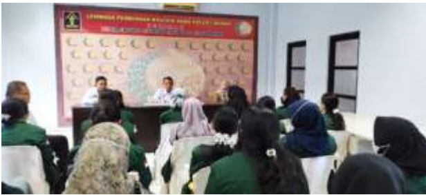
Gambar 2. Observasi dan Wawancara Pendahuluan Tim Pengabdian di LPKA Kelas 1 Medan

Tim Pengabdian telah melakukan observasi dan wawancara pendahuluan pada tanggal 4 Mei 2023. Berdasarkan hasil penelusuran, tim menemukan bahwa sebagian besar tahanan di LPKA Kelas I Medan memiliki sejumlah permasalahan bawaan, seperti (1) hubungan keluarga yang kurang harmonis; (2) kondisi finansial keluarga yang tergolong menengah ke bawah; hingga (3) akses pendidikan yang kurang memadai saat masih berada di luar tahanan. Situasi tersebut menyebabkan sejumlah tahanan memiliki status pendidikan yang tidak sesuai dengan usianya, sehingga dikhawatirkan dapat mempersulit mereka untuk mendapatkan masa depan yang baik setelah keluar dari tahanan.