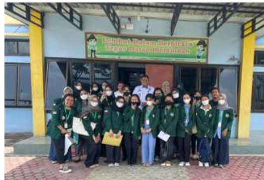
Gambar 1. Tampak Depan Lembaga Pembinaan Khusus Anak Kelas I Medan

untuk memberikan akses pendidikan kepada tahanan anak.