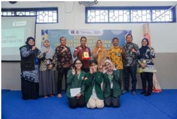
Gambar 7. Pelaksanaan Psikoedukasi Mengenai Ragam Jurusan untuk Anak Binaan

Psikoedukasi mengenai ragam jurusan untuk Anak Binaan dilaksanakan pada 7 September 2023. Pada kegiatan ini, anak binaan mendapatkan informasi mengenai ragam jurusan, alur masuk perguruan tinggi, karir yang dapat ditempuh setelah memilih sebuah jurusan, beasiswa, hingga sharing session kuliah sambil bekerja.