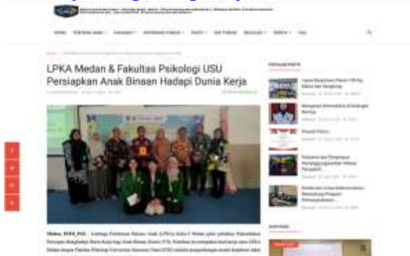
Gambar 10. Bukti Publikasi Media Massa di Kanal Berita Nasional dari Direktorat Jenderal Perasyarakatan Kementerian Hukum dan HAM pada Tanggal 11 September 2023