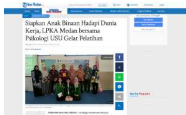
Gambar 12. Bukti Publikasi Media Massa di Kanal Berita Lokal Harian Waspada pada Tanggal 12 September 2023