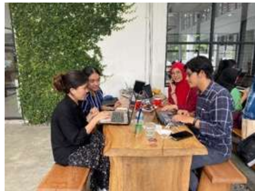
Gambar 5. Diskusi Permasalahan Belajar yang Dihadapi oleh Anak Binaan di LPKA Kelas I Medan

Diskusi Tim Pengabdian Fakultas Psikologi USU mengenai solusi permasalahan belajar di LPKA Kelas I Medan dilaksanakan pada 15 Juni 2023. Kegiatan diskusi ini turut mengundang dosen, mahasiswa dan alumni yang membantu kegiatan pengabdian. Berdasarkan hasil diskusi, tim bersepakat untuk mengembangkan model eksplorasi bakat untuk meningkatkan kematangan karir pada anak didik permasyarakatan di LPKA Kelas I Medan.