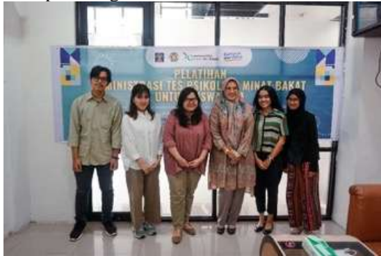
Gambar 6. Pelaksanaan Pelatihan Administrasi Tes Minat dan Bakat untuk Mahasiswa Fakultas Psikologi USU

diperoleh, mahasiswa mendapatkan peningkatan kemampuan dalam mengadministrasikan tes, namun masih memerlukan supervisi karena terbatasnya pengalaman lapangan, terutama ketika berhadapan dengan anak binaan.