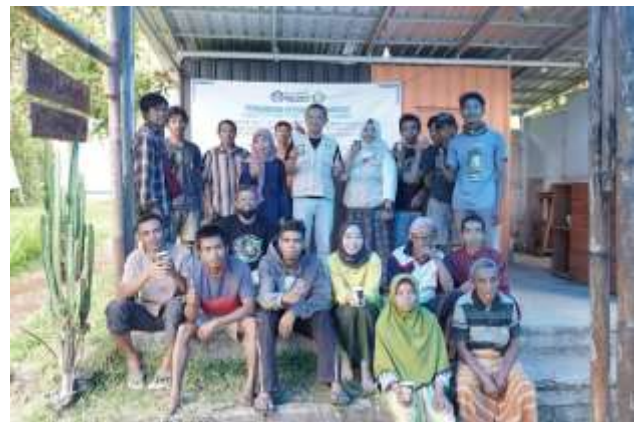
Gambar 2. Sosialisai Manajemen Keuangan

Dalam kegiatan sosialisasi petani tidak hanya diperkenalkan dengan konsep teori manajemen keuangan yang sudah disebutkan sebelumnya melainkan juga bagaimana menghitung pendapatan dan laba kotor, pengeluaran, laporan laba rugi, dan persediaan. Tim juga memberikan wawasan mengenai bagaimana merencanakan pendapatan dan pengeluaran ke depan. Kemudian bagaimana melakukan savings sehingga dapat menambah modal usaha petani dengan tidak mencampur adukkan aktivitas keuangan bersama aktivitas pribadi.