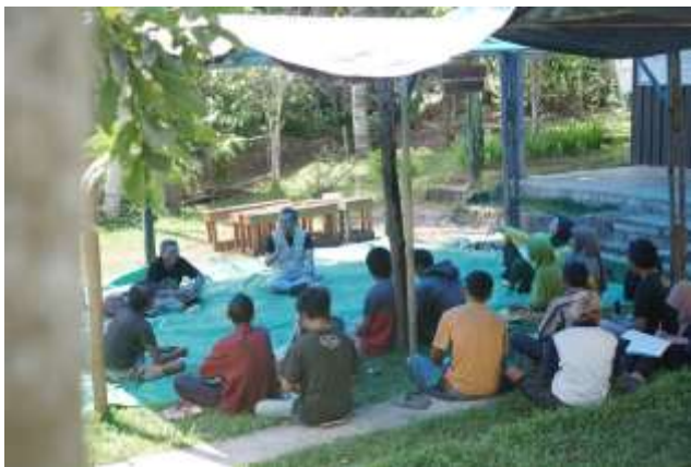
Gambar 3. Pelatihan Manajemen Keuangan