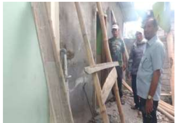
Proses pembagunan dimulai dengan menentukan lokasi tempat wudhu

Proses pembuatan tempat wudhu dilakukan secara gotong royong dengan melibatkan guru, orang tua, dan masyarakat sekitar. Kegiatan ini tidak hanya mempercepat proses pembangunan, tetapi juga meningkatkan rasa kebersamaan dan tanggung jawab komunitas.