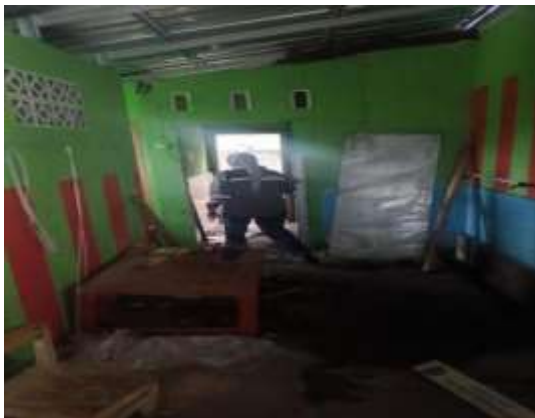
Tempat wudhu sebelumnya yang digunakan oleh siswa TK PKK Ijobalit

Setelah mengidentifikasi kebutuhan, dilakukan perancangan tempat wudhu yang ramah anak. Desain yang dibuat mempertimbangkan aspek keamanan, kenyamanan, dan aksesibilitas bagi anak-anak.