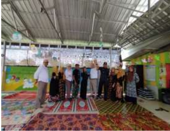
Foto bersamaan saat persemian tepat wudhu

menjaga kebersihan dan tata cara berwudhu yang benar.