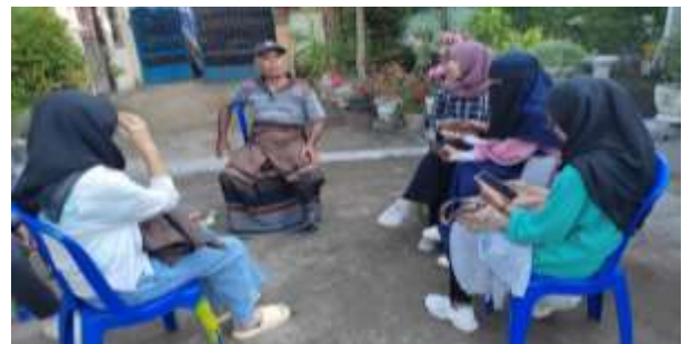
Gambar 6. (Survei jumlah lansia yang membutuhkan kaca mata di Kelurahan Ijobalit)

Tahap pertama yaitu melakukan survei mendalam untuk mengetahui jumlah lansia yang membutuhkan kacamata baca dan jenis lensa yang dibutuhkan. Selanjutnya bekerjasama dengan optik atau lembaga terkait untuk mendapatkan kacamata baca dengan berbagai ukuran dan kekuatan lensa dengan memastikan kualitas kacamata terjamin dan sesuai dengan standar kesehatan mata. Pada tahap ini dilakukan juga sosialisasi untuk menginformasikan program kepada masyarakat lansia Kelurahan Ijobalit. dengan menjelaskan manfaat program dan cara mendapatkan kacamata baca gratis.