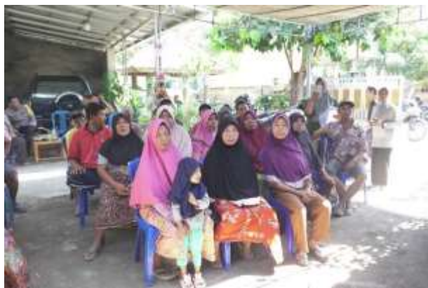
Gambar 10. (Pemeriksaan ukuran lensa kacamata kepada penerima lansia di Kelurahan Ijobalit)