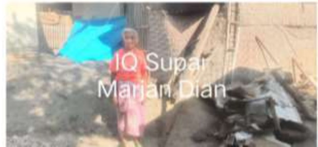
Gambar 1. (Penerima bantuan Toilet kepada salah satu lansia di Kelurahan Ijobalit)

Tahap pertama yaitu tahap persiapan, kegiatan yang dilakukan adalah melakukan survei mendalam di Kelurahan Ijobalit untuk mengidentifikasi lansia yang benar-benar membutuhkan fasilitas toilet yang layak. Selanjutnya merencanakan anggaran yang dibutuhkan untuk seluruh kegiatan, mulai dari pembelian bahan bangunan hingga tenaga kerja serta pengadaan bahan bangunan dengan harga yang kompetitif dan kualitas yang terjamin.