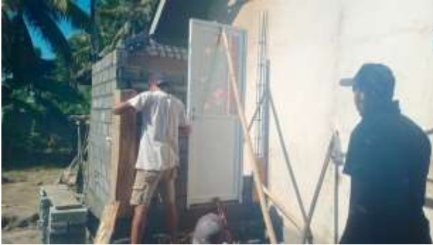
Gambar 4. (Proses Pelaksanaan Pembangunan Toilet di Kelurahan Ijobalit)