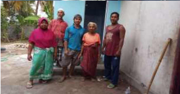
Gambar 5. (Pembangunan Toilet 100% di Lokasi penerima bantuan di Kelurahan Ijobalit)

Tahap ketiga yaitu monitoring dan evaluasi, pada tahap ini dilakukan pemantauan secara berkala terhadap proses pembangunan toilet. Setelah proyek selesai, dilakukan evaluasi untuk mengukur keberhasilan program dengan mengumpulkan data mengenai tingkat kepuasan pengguna, dampak terhadap kesehatan, dan keberlanjutan program.