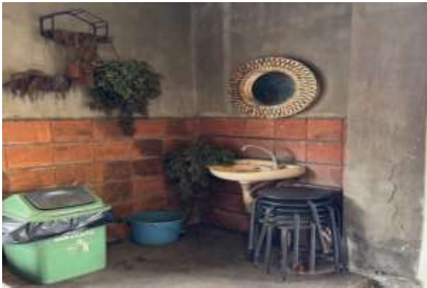
Gambar 2. Wastafel Kanthi Coffee and Eatery

Berdasarkan Gambar 1 merupakan lokasi mitra yang berada di Jl Dharmawangsa yang bersebelahan dengan barber shop dan berada di 0 jalan raya sehingga memiliki potensi yang tinggi untuk dikunjungi. Dari segi lahan parkir meskipun tidak luas akan tetapi cukup untuk memuat 20 sepeda motor dan 3 mobil yang terparkir didepan coffee shop. Selanjutnya akan disajikan bagian dalam mitra sebagai berikut: