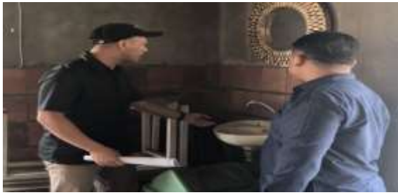
Gambar 9. Pelatihan dan Pendampingan K3

Mitra menerima pelatihan intensif dalam analisis tren dan preferensi pelanggan, yang memungkinkan mereka untuk memperluas segmentasi pasar secara lebih efektif. Keterampilan dalam melayani pelanggan juga mengalami peningkatan, yang berkontribusi terhadap kepuasan pelanggan yang lebih tinggi. Terjadi peningkatan keterampilan sebesar 10% dalam melayani dan memperluas segmentasi pasar, yang diukur melalui survei pelanggan dan laporan penjualan. Selanjutnya kegiatan peningkatan pengetahuan marketing online akan terlihat dalam gambar