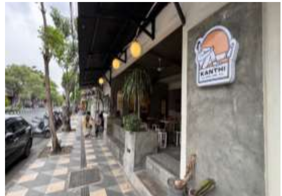
Gambar 1. Lokasi Bagian Depan Mitra

Analisis Situasi pelaksanaan kegiatan pengabdian masyarakat di “Kanthi Coffe and Eatery” berlokasi di Jl. Dharmawangsa No. 138A Kecamatan Gubeng Kota Surabaya. Fokus pengabdian masyarakat ini yaitu pengembangan sumber daya manusia yang diwujudkan dalam mengatasi permasalahan mitra bidang produksi dan bidang keuangan. Stand mitra memiliki luas pxl 8x5 meter dan hanya memiliki satu stand di Kota Surabaya. Pengabdian masyarakat ini dimaksudkan untuk memberdayakan mitra dari segi produksi dan keuangan. Kondisi empiris mitra selanjutnya akan disajikan sebagai berikut: