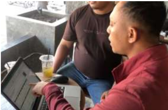
berikut: Gambar 10. Pelatihan Pencatatan Laporan Keuangan

Mitra menerima pelatihan intensif dalam analisis tren dan preferensi pelanggan, yang memungkinkan mereka untuk memperluas segmentasi pasar secara lebih efektif. Keterampilan dalam melayani pelanggan juga mengalami peningkatan, yang berkontribusi terhadap kepuasan pelanggan yang lebih tinggi. Terjadi peningkatan keterampilan sebesar 10% dalam melayani dan memperluas segmentasi pasar, yang diukur melalui survei pelanggan dan laporan penjualan. Selanjutnya kegiatan peningkatan pengetahuan marketing online akan terlihat dalam gambar