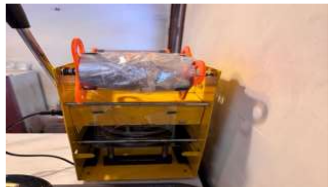
Gambar 6. Mesin Press Plastik

Terdapat beberapa lubang di atap yang membutuhkan perbaikan, selain itu kebersihan dari toilet masih membutuhkan perhatian lebih. Kemudian pembahasan soal kebersihan dalam toilet juga belum terdapat gulungan tisu yang harusnya dapat dimanfaatkan oleh konsumen. Selanjutnya akan disajikan mesin press yang kurang optimal untuk packaging dan tentunya akan menurunkan kualitas produksi sebagai berikut: