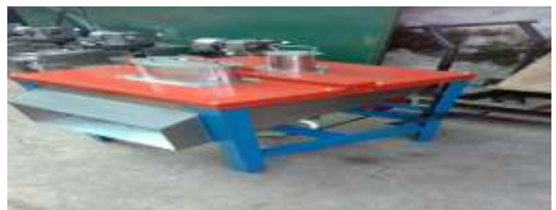
Gambar Diseminasi TTG Keripik Pisang

TTG Keripik Pisang menggunakan bahan stainless stell yang aman untuk makanan ( foodgrade ), dan memiliki ketahanan panas yang sama dengan baja. Hal ini penting agar kualitas rasa keripik pisang yang dihasilkan sama dengan sebelumnya. TTG ini memiliki dimensi 85x50x95 cm dengan kapasitas 20 - 25 kg/jam hasil rajang menggunakan daya listrik 350 watt. Dengan menggunakan TTG ini kapasitas produksi akan meningkat hingga 4 kali lipat di mana sebelumnya menggunakan dengan manual.