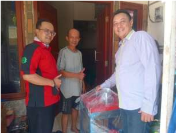
Gambar Penyerahan TTG kepada Mitra

memberikan keputusan pendanaan melalui skema kredit usaha mikro. Dalam pelatihan ini juga di kenalkan juga aplikasi akuntansi berbasis android.