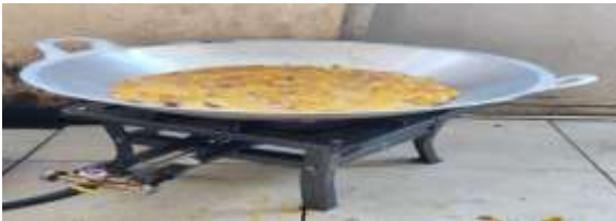
Gambar Peralatan kompor jos dan wajan besar.

produksi dari TTG Keripik Pisang, agar irisan pisang yang di goreng bisa lebih cepat dan lebih banyak serta kualitas produk terjaga.