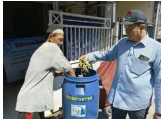
Gambar Peralatan tong komposter

Selama ini mitra membuang sampah buah, kulit dan batang pisang langsung ke tempat sampah, hal ini bisa menimbulkan bau tidak sedap dan menambah volume sampah organik pada tempat pembuangan sampah. Oleh karena itu Tim memberikan tong komposter untuk mengolah limbah sampah organik mitra, agar dapat memberikan manfaat pada lingkungan sekitar. Dari tong komposter tersebut, di hasilkan pupuk padat dan pupuk cair, dapat di gunakan untuk menyuburkan tanaman masyarakat sekitarnya.