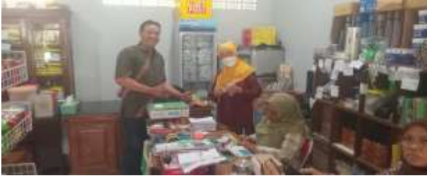
Gambar Kemitraan dengan Koperasi

Karyawan Wijaya Putra untuk untuk penjualan mitra di toko milik koperasi.