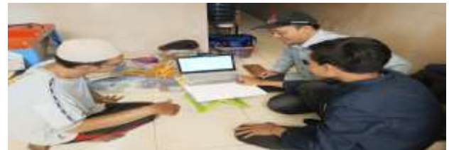
Gambar Pelatihan dan pendampingan pembuatan logo

Kemasan dan logo ini telah memenuhi standar dari Dinas Kesehatan, diantaranya kemasan plastik lebih tebal, logo memuat nama merk “JOYO”, nama produk, slogan, komposisi, berat bersih, tanggal kadaluarsa, alamat dan nomor telepon mitra.