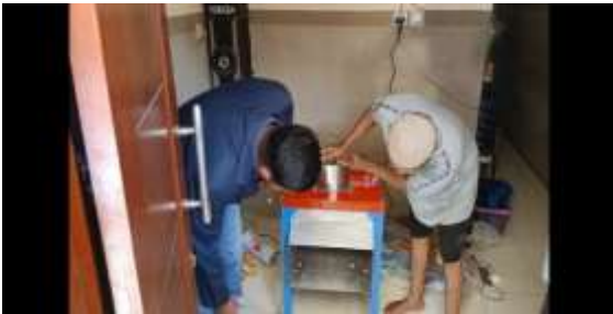
Gambar Pelatihan pengoperasian TTG Keripik Pisang dan Maintenance Ringan

memproduksi sehat dengan menggunakan perlengkapan yang aman dan sehat untuk produk makanan, diantaranya menggunakan penutup kepala, masker, sarung tangan, celemek dan menggunakan perlengkapan yang foodgrade.