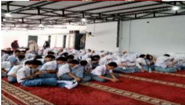
Gambar 1. Kegiatan Sosialisasi

Pada masa remaja, mereka akan mulai mengalami berbagai perubahan fisik, kognitif, hingga psikososial. Dalam perubahan fisik yang dialami remaja ditandai dengan perubahan secara primer dan sekunder. Beberapa perubahan ditandai dengan mulai tumbuhnya rambut-rambut pada bagian tubuh tertentu, perubahan bentuk tubuh, tanda-tanda pubertas (menstruasi dan mimpi basah), dan kematangan alat-alat reproduksi (Papalia & Martorell, 2021). Adanya rasa ingin tahu dan penasaran dari remaja terkait seksualitas membutuhkan pendampingan dan arahan dari orang-orang dewasa (Cheer et al., 2004). Selain itu, adanya pemahaman terkait seksualitas yang sehat merupakan bagian usaha untuk menjaga kesejahteraan remaja. Berdasarkan badan kesehatan dunia WHO (WHO, 2006), menyatakan bahwa