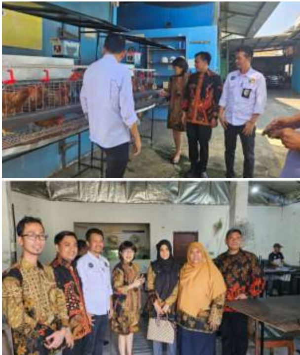
Gambar 2 Dokumentasi Kegiatan

Penyerahan dilakukan dengan susunan acara atau rundown acara yaitu (1) Pembukaan oleh Lembaga Pemberdayaan Ekonomi Rakyat (LPER). (2) Sambutan pemegang hak paten Teluria. (3) Sambutan Rektor UNUPI dilanjutkan dengan paparan dari Wakil Rektor 1 Bidang akademik dan paparan dari Wakil Rektor III Bidang Kemahasiswaan dan Kerjasama