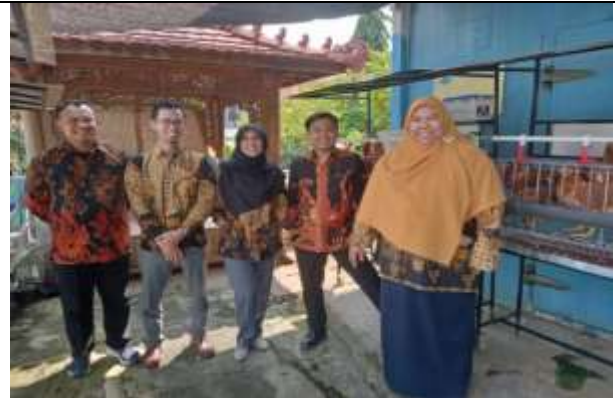
Gambar 4 Dokumentasi kunjungan ke kandang ayam

Kegiatan diakhiri dengan kunjungan ke kandang ayam petelur dan workshop perakitan pembuatan kandang ayam petelur yang berada di lokasi yang berbeda namun masih dekat dengan peternakan ayam petelur Teluria. Foto bersama sebelum tim kembali ke kampus. Beberapa masukan dari kegiatan ini antara lain kegiatan akan dilanjutkan dengan digitalisasi (Winanti et al., 2024) pemberian pakan ayam dan penyemprotan pembersihan kotoran ayam agar lebih cepat dan mudah.