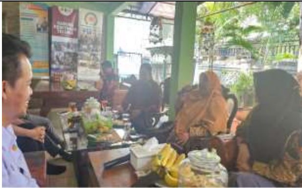
Gambar 3 Dokumentasi Kegiatan

Kegiatan dilanjutkan dengan diskusi santai antara kampus, Teluria dan LPER. Beberapa hal dibahas diantaranya mengenai bagaimana Teluria bisa naik kelas dan semakin eksis dalam pengentasan kemiskinan dan peningkatan ketahanan pangan keluarga. Ekonomi yang semakin tidak menentu seperti saat akibat perang di Rusia dan Timur Tengah yang tidak kunjung selesai berakibat harga-harga mengalami peningkatan terutama barang-barang yang bahan bakunya impor dari negara-negara tersebut (Bakrie et al., 2022). Masyarakat dituntut untuk terus hidup dengan kondisi barang-barang yang semakin mahal. Teluria hadir dan membantu mengatasi masalah ketahanan pangan keluarga. Konsep satu RW seribu telur telah merambah di beberapa wilayah di kota Bekasi dan terus berkembang di wilayah-wilayah lain.