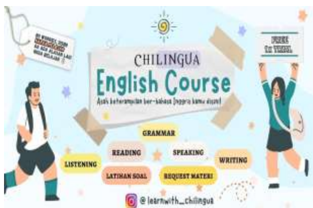
Gambar 1. Banner

Permasalahan yang di hadapi mitra adalah permasalahan soft skill para tutor dalam mengajar bahasa Inggris masih sangat sederhana dengan cara memberi penjelasan dari buku diktat yang ada disertai memberikan tugas yang ada di buku diktat tersebut. Adapula yang menggunakan Flash Card sebagai alat peraga. Berikut adalah aktifitas – aktifitas ketika mengajar di kelas: