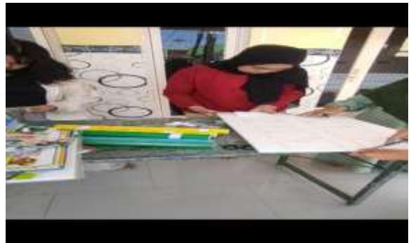
Gambar 7. Pelatihan pembuatan media ajar

3) Pemberian pelatihan penggunaan Vocabulary Board untuk pengajaran vocabulary dikelas langsung kepada siswa.