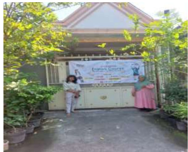
Gambar 3. Tempat mitra

Jumlah kelas yang tersedia baru 1 ruangan yang berada di ruang tamu yang dikondisikan sebagai kelas. Dengan fasilitas papan tulis, kursi, dan alat tulis. Masing masing kelas bisa menampung maksimal 8 murid setiap kali sesi dengan durasi 90 menit.