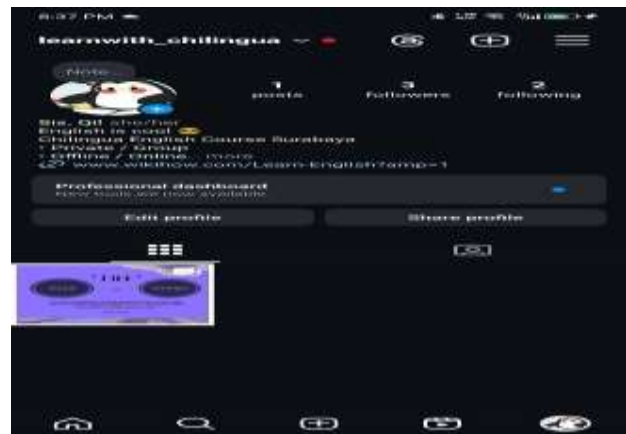
Gambar 13. SS Medsos Instagram