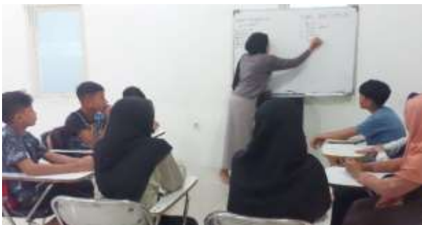
Gambar 5. Aktifitas mengajar

Dari gambar diatas terlihat bahwa murid dan guru tetap pada tempatnya yang seharusnya murid bisa lebih aktif agar tidak merasa bosan dan perlu adanya penambahan metode mengajar. Menurut (puspasari : 2016) dalam artikelnya menyimpulkan bahwa metode WordWall dapat meningkatkan kemampuan penguasaan kosakata Bahasa Inggris siswa. Sedangkan menurut (I gusti : 2023) menyatakan bahwa metode pengajaran untuk meningkatkan kosakata bahasa inggris dapat menggunakan Flash Card. (Nur hikmah : 2019) dalam artikelnya juga menyebutkan bahwa penggunaan FlashCard juga dapat meningkatkan kemampuan kosakata bahasa inggris para siswa. Dari keseluruhan artikel tersebut diatas memperlihatkan bahwa penggunaan alat dalam pengajaran kosakata bahasa inggris sangat diperlukan dalam meningkatkan kemampuan kosakata para siswa khususnya siswa yang duduk dibangku TK dan