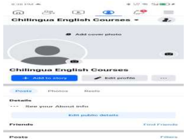
Gambar 12. SS medsos Facebook

2) Pelatihan penggunaan akun sosial media facebook, instagram, tiktok, dan youtube sebagai sarana pemasaran.