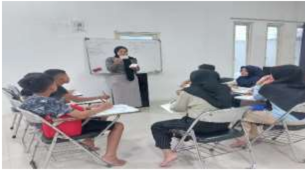
Gambar 4. Aktifitas mengajar