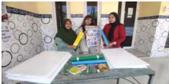
Gambar 6. Penyerahan bahan dan alat

Berikut adalah aktifitas penyerahan bahan dan alat kepada mitra sebagai media ajar.