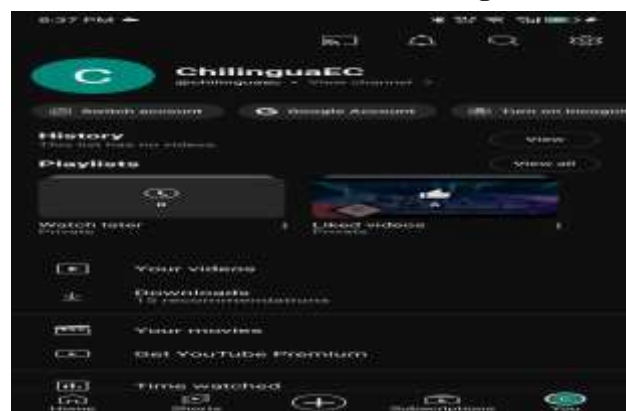
Gambar 14. SS Medsos Youtube