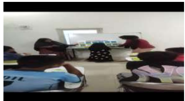
Gambar 9. Pelatihan penggunaan Vocabulary Board untuk pengajaran