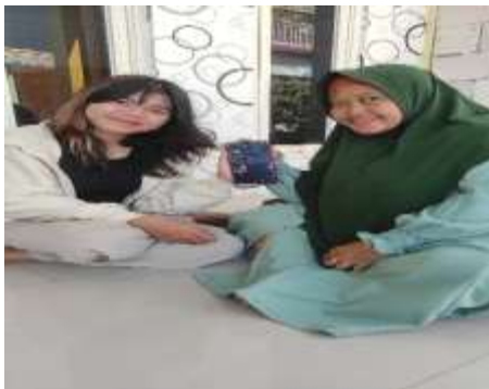
Gambar 11. Pelatihan pembuatan akun medsos

1) Pelatihan Pembuatan akun sosial media Instagram, Tiktok, facebook, dan youtube.