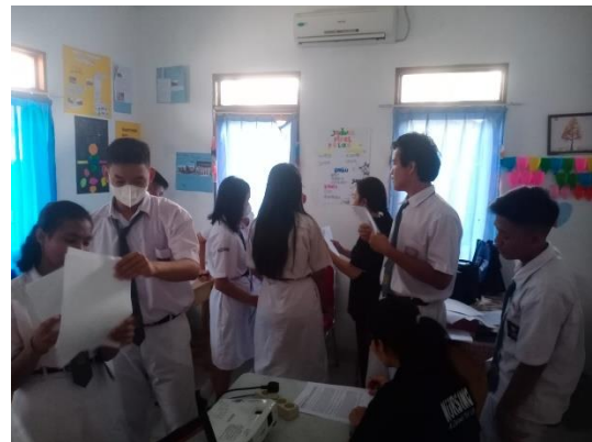
Gambar 5. (Siswa sedang berlatih dalam kelompok)

Pada minggu ketiga, pelatihan difokuskan pada persiapan lomba storytelling antar siswa yang dilaksanakan pada minggu selanjutnya. Pemateri memulai sesi dengan menjabarkan beberapa cerita rakyat, dan memberi siswa waktu untuk membaca serta memilih satu cerita yang akan mereka tampilkan ketika lomba. Pada saat sesi membaca, beberapa siswa menemukan kosakata Bahasa Inggris yang tidak mereka pahami, namun mereka tidak ragu bertanya kepada pemateri dan fasilitator. Setelah memilih cerita yang mereka sukai, siswa kemudian mulai berlatih pengucapan dan intonasi dengan bimbingan pemateri. Mereka dibagi menjadi kelompok kecil untuk saling memberikan masukan dan berlatih di depan teman-teman mereka. Setiap siswa diberi kesempatan untuk tampil di depan kelas, di mana pemateri memberikan koreksi pada cara pengucapan, ekspresi, serta penggunaan gesture yang tepat untuk meningkatkan storytelling mereka. Beberapa siswa juga memperkaya penampilan mereka dengan menambahkan gerakan tubuh dan mimik wajah sesuai dengan cerita yang dibawakan, sambil mendapatkan masukan dari teman-teman dan fasilitator agar penampilan mereka lebih maksimal.