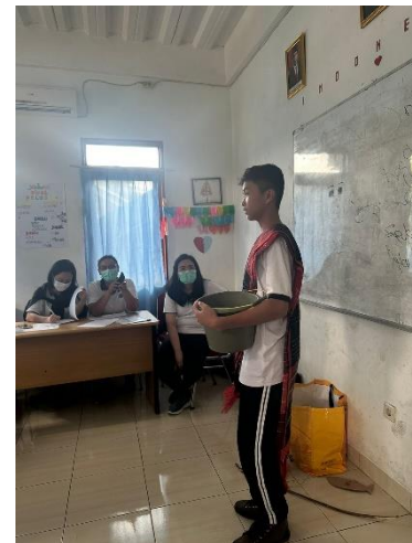
Gambar 7. (Siswa sedang menceritakan kisah Malin Kundang)

serta gestur dengan baik, menunjukkan hasil latihan yang mereka lakukan selama tiga minggu terakhir. Namun, ada juga beberapa siswa yang terlihat grogi dan berbicara dengan terbata-bata. Meski demikian, mereka tetap menunjukkan keberanian untuk mencoba dan menyelesaikan cerita mereka. Secara keseluruhan, lomba ini tidak hanya menekankan pada performa yang sempurna, tetapi juga pada keberanian siswa dalam berbicara dan berinteraksi menggunakan Bahasa Inggris. Setiap siswa berhasil menyampaikan cerita yang mereka pilih, meskipun dengan tingkat kepercayaan diri yang berbeda-beda. Ini menunjukkan perkembangan yang signifikan dalam kemampuan berbahasa mereka, terutama dalam hal keberanian untuk berbicara di depan umum.