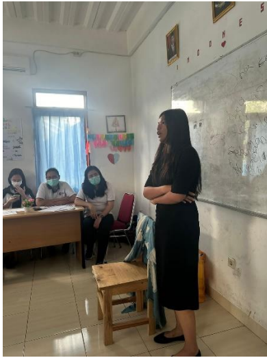
Gambar 8. (Siswa sedang menceritakan legenda Batu Menangis)

Evaluasi pelatihan storytelling selama satu bulan menunjukkan bahwa kegiatan ini berlangsung dengan baik dan berhasil mencapai tujuan utama. Meskipun ada kendala dalam penentuan jadwal karena padatnya agenda sekolah, hal ini dapat diatasi melalui serangkaian diskusi dengan kepala sekolah untuk menyesuaikan waktu pelatihan. Tantangan lainnya adalah memancing keaktifan siswa yang pada minggu-minggu awal masih cenderung pasif. Untuk mengatasi hal ini, pendekatan persuasif dilakukan dengan mendekati siswa secara personal, mengajukan pertanyaan langsung kepada mereka, serta menunjuk beberapa siswa untuk maju ke depan dan memberikan dorongan semangat. Strategi ini terbukti efektif, karena pada minggu ketiga dan keempat, siswa menjadi lebih aktif dan percaya diri. Hasil evaluasi akhir melalui kuesioner menunjukkan bahwa semua siswa merasa puas dengan pelaksanaan pelatihan ini dan merasakan peningkatan signifikan dalam kemampuan berbicara mereka. Mereka bahkan menyatakan keinginan agar kegiatan serupa dapat diadakan lagi di masa depan.