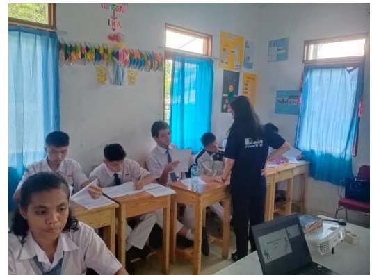
Gambar 2. (Pemateri mendampingi siswa)

Selanjutnya pada minggu kedua, siswa belajar lebih dalam mengenai teknik-teknik storytelling , termasuk penggunaan intonasi, ekspresi wajah, dan gestur tubuh untuk membuat cerita lebih menarik dan hidup. Mereka juga diajarkan bagaimana membangun alur cerita yang efektif, menciptakan karakter yang kuat, dan menyesuaikan gaya bahasa dengan audiens yang berbeda. Pada minggu ini, siswa tampak lebih berani bertanya kepada pemateri dan tidak sepesif minggu sebelumnya. Beberapa siswa juga tidak ragu mengajukan pertanyaan dalam Bahasa Inggris, meskipun agak terbata-bata. Saat sedang menjelaskan, pemateri turut mencontohkan penyampaian cerita yang baik dalam Bahasa Inggris, menggunakan teknik yang diajarkan. Setelah mencontohkan, pemateri meminta siswa maju ke