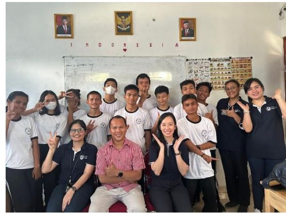
Gambar 9. (Tim PkM bersama Kepala Sekolah dan Siswa-siswi SMAK Kasih Anugerah)

Evaluasi pelatihan storytelling selama satu bulan menunjukkan bahwa kegiatan ini berlangsung dengan baik dan berhasil mencapai tujuan utama. Meskipun ada kendala dalam penentuan jadwal karena padatnya agenda sekolah, hal ini dapat diatasi melalui serangkaian diskusi dengan kepala sekolah untuk menyesuaikan waktu pelatihan. Tantangan lainnya adalah memancing keaktifan siswa yang pada minggu-minggu awal masih cenderung pasif. Untuk mengatasi hal ini, pendekatan persuasif dilakukan dengan mendekati siswa secara personal, mengajukan pertanyaan langsung kepada mereka, serta menunjuk beberapa siswa untuk maju ke depan dan memberikan dorongan semangat. Strategi ini terbukti efektif, karena pada minggu ketiga dan keempat, siswa menjadi lebih aktif dan percaya diri. Hasil evaluasi akhir melalui kuesioner menunjukkan bahwa semua siswa merasa puas dengan pelaksanaan pelatihan ini dan merasakan peningkatan signifikan dalam kemampuan berbicara mereka. Mereka bahkan menyatakan keinginan agar kegiatan serupa dapat diadakan lagi di masa depan.