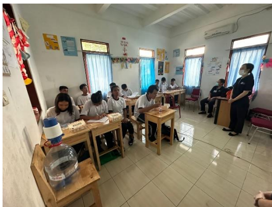
Gambar 4. (Siswa sedang mempersiapkan diri untuk presentasi)

Kegiatan pelatihan storytelling hari itu ditutup dengan sesi presentasi di mana setiap siswa diberi kesempatan untuk menceritakan kembali sebuah cerita di depan kelas secara singkat. Mereka menerima umpan balik dari teman-teman dan pemateri mengenai kekuatan dan area yang perlu diperbaiki dalam penyampaian cerita mereka. Pelatihan diakhiri dengan diskusi kelompok untuk merefleksikan pelajaran yang dipetik serta saran untuk pengembangan lebih lanjut.