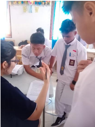
Gambar 6. (Siswa sedang berkonsultasi dengan fasilitator)

Evaluasi selama minggu ketiga menunjukkan adanya perubahan signifikan dalam keaktifan siswa. Di minggu awal, sebagian besar siswa terlihat malu-malu dan canggung saat berbicara dalam Bahasa Inggris, sering kali ragu untuk mengungkapkan ide atau bertanya. Namun, pada minggu ketiga, suasana kelas menjadi lebih dinamis. Siswa mulai lebih percaya diri dalam berlatih storytelling, bahkan antusias berdiskusi dan memberikan masukan kepada teman sekelompok mereka. Keberanian mereka bertanya mengenai kosakata atau tata bahasa yang kurang dipahami juga meningkat, menunjukkan adanya kemajuan yang positif dalam keterampilan berbahasa Inggris serta keaktifan mereka selama proses latihan.