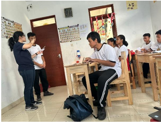
Gambar 3. (Siswa maju untuk praktek storytelling )

depan kelas untuk mempraktekkan penggalan adegan dari beberapa cerita, sekaligus belajar menerapkan teknik storytelling .