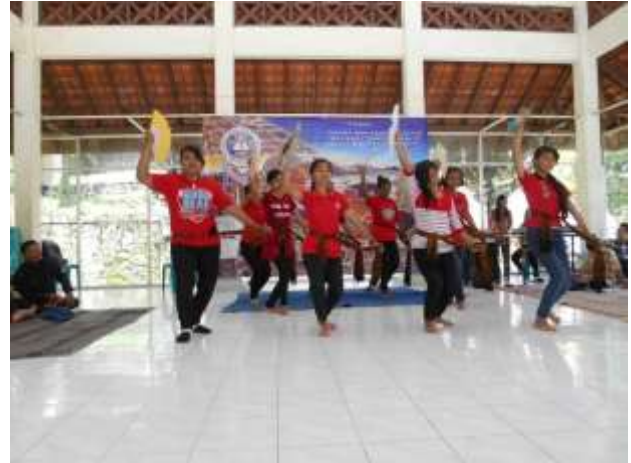
Gambar 1. Ekstrakurikuler Tari

Visi dan misi ini kemudian diimplementasikan oleh SMA Imanuel Kalasan melalui kegiatan belajar mengajar di kelas dan sejumlah kegiatan ekstrakurikuler, seperti paduan suara, pramuka, seni tari, teater, dan aktivitas kolaborasi lainnya. Berbagai kegiatan pendidikan dan pengajaran SMA Imanuel Kalasan tampak pada Gambar 1, Gambar 2, Gambar 3, dan Gambar 4 berikut ini. Dengan adanya berbagai kegiatan ini, para siswa dan siswi diharapkan dapat memiliki budi pekerti luhur, mandiri, dan berdaya saing tinggi. Mereka juga dapat mendemonstrasikan penguasaan ilmu pengetahuan dan akhlak mulia sesuai dengan tuntutan Kurikulum Tingkat Satuan Pendidikan (KTSP) sehingga menjadi aset bagi pembangunan bangsa dan negara.