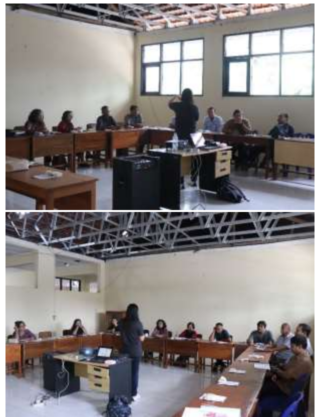
Gambar 6. Pelaksanaan Pelatihan Sesi 2 Secara Luring di SMA X

Ada sesi berikut nya ttg regulasi dlm belajar biar lebih paham dlm melakukan dlm PBM