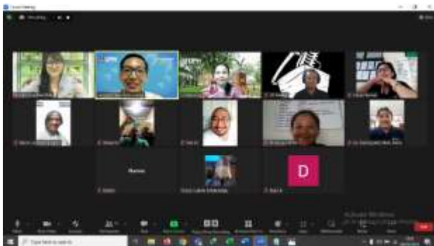
Gambar 5. Pelaksanaan Pelatihan Sesi 1 Secara Daring

Sesi kedua dilaksanakan pada Jumat, 15 Maret 2024 secara luring, di SMA X. Sesi ini dihadiri oleh 13 guru. Pada sesi ini, peserta dipaparkan dengan materi yang berisikan strategi mengajarkan regulasi diri dalam belajar kepada siswanya. Sesi diawali dengan perkenalan, sesi ice breaker singkat, lalu dilanjutkan dengan tujuan pelatihan, agenda pelatihan, serta harapan dari pelatihan ini. Sesi dilanjutkan dengan paparan materi, yang terdiri dari mengenai apa itu regulasi diri dalam belajar, mengapa kita perlu mengetahui dan memiliki keterampilan regulasi diri dalam belajar, mengapa kita perlu mempelajari cara mengajarkannya kepada siswa kita, dan terakhir guru dipaparkan beberapa alat bantu seperti jurnal proyek, lembar refleksi harian, poster regulasi diri dalam belajar, poster perasaan/emosi untuk regulasi emosi, dan lain sebagainya, lalu diajak untuk berlatih menggunakan beberapa alat bantu tersebut.