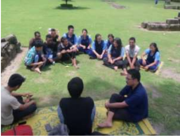
Gambar 4. Aktivitas Pembelajaran Luar Kelas

Adapun, tantangan yang dihadapi oleh SMA Imanuel Kalasan cukup besar dalam menciptakan lingkungan pendidikan dan proses pembelajaran yang optimal. Berdasarkan asesmen kebutuhan yang dilakukan oleh tim pengabdian masyarakat UPH bersama GKI Gejayan, sebagian siswa yang belajar di SMA Imanuel Kalasan berasal dari keluarga broken home . Perceraian orangtua dan kurangnya penerimaan dalam keluarga membuat para siswa ini kesulitan menempatkan diri, membangun karakter, dan identitas diri yang positif. Ayah dan ibu mereka bahkan saling menolak kehadiran mereka di keluarga. Kondisi di rumah ini mempengaruhi emosi dan perilaku siswa selama di sekolah, terutama berdampak pada menurunnya performansi belajar akademik.