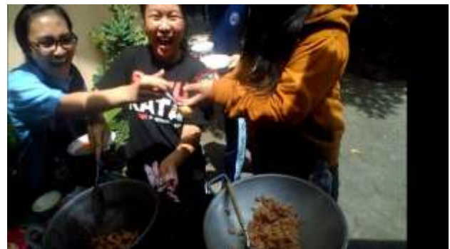
Gambar 2. Ekstrakurikuler Memasak