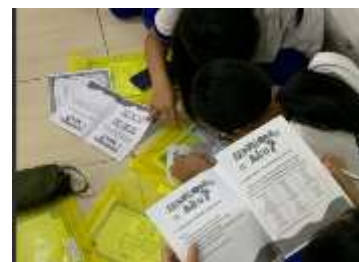
Gambar 2. Proses pengerjaan Lembar Kerja Pengenalan Emosi

Selain mengenal kekuatan dan area pengembangan diri, para siswa juga diminta untuk mengenali jenis emosi dan emosi yang sering kali mereka rasakan. Kegiatan diawali dengan mengenalkan jenis emosi dan belajar merasakan emosi spesifik pada suatu situasi melalui diskusi dan pengerjaan lembar kerja 3.