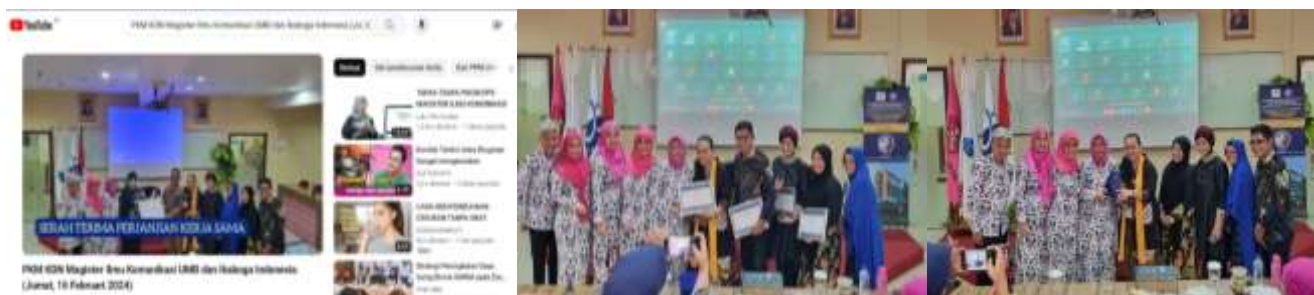
Gambar 8. Kegiatan PKM Pada Hari Jumat, 16 Februari 2024

Universitas Mercu Buana dan DPP Ikaboga Indonesia (Ref. Gambar 8.)