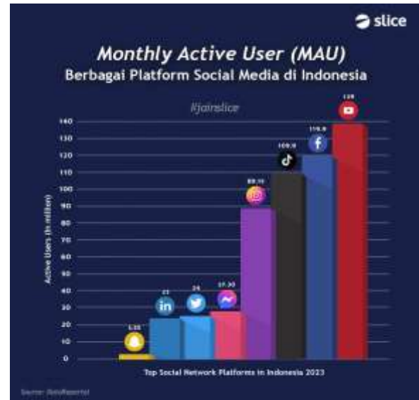
Gambar 2. Platform Jejaring Sosial Teratas di Indonesia Tahun 2023

Sesungguhnya branding telah ada sejak awal tahun 2700 SM dan menjadi penting pada tahun 1960an (Navaneethakrishnan Kumar, 2021), karena dapat menempatkan organisasi ataupun perusahaan di atas kompetitor lainnya. Branding adalah cara untuk menghadirkan produk dan layanan melalui kekuatan brand (merek), yang dapat dilakukan dan diperkuat dengan menggunakan berbagai alat dan tindakan (Philip Kotler, 2016). Adapun komunikasi merupakan sumber kehidupan bagi brand (merek) dan semua upaya branding apapun (Keller, 2020). Brand (merek) memperoleh arti penting pada abad ke-20 dan menjadi ciri khas bagi produk yang sukses (Navaneethakrishnan Kumar, 2021). Brand juga dapat memainkan banyak peran penting karena dapat menghadirkan banyak makna dalam benak siapapun yang melihatnya (Philip Kotler, 2016). Jadi agar brand organisasi Ikaboga Indonesia dikenal luas, maka kompetensi teknis upaya branding melalui media sosial juga penting dikuasai.