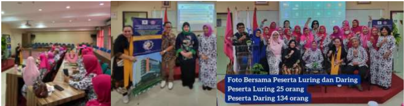
Gambar 7. Kegiatan PKM, 90,5% didominasi Perempuan

Pada acara ini juga dilakukan perjanjian kerjasama serta penyerahan plakat, dari dan kepada