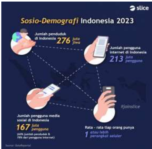
Gambar 1. Jumlah Pengguna Media Sosial di Indonesia Tahun 2023