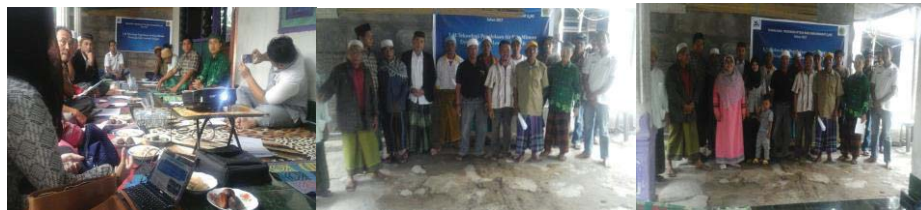
Gambar 5. Sosialisasi unit pengolahan air

Pemaparan materi tentang prinsip dasar pengolahan air siap minum menjadi materi inti yang disampaikan pada sosialisasi ini. Metode yang digunakan adalah ceramah dan dilanjutkan dengan diskusi/tanya jawab untuk mengetahui sejauh mana pemahaman peserta dalam menerima materi seperti tampak pada Gambar 5. Kegiatan sosialisasi dilanjutkan dengan pengenalan alat secara langsung dan mencoba minum air hasil pengolahan.