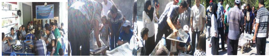
Gambar 2 Sosialisasi kegiatan Di Desa Akar-Akar Kec. Bayan-Lombok Utara

korosi. Metode yang digunakan adalah ceramah dan dilanjutkan dengan diskusi/tanya jawab untuk mengetahui sejauh mana pemahaman peserta dalam menerima materi. Kegiatan sosialisasi dilanjutkan dengan pengenalan alat secara langsung, seperti tempat pada Gambar 2.