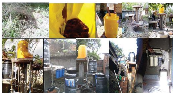
Gambar 4. Pembangunan unit pengolahan air

Pembangunan dan pengujian unit pengolahan air dilakukan kurang lebih selama seminggu. Air hasil pengolahan diujikan beberapa parameter kimia (Fe, nitrit, amonia, BOD 5 , COD, DO) dan biologi (bakteri E-coli). Tahapan pembangunan unit pengolahan ditampilkan pada Gambar 4 berikut