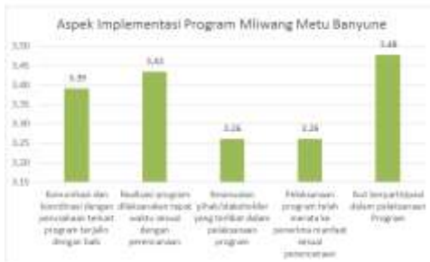
Gambar 1. Indeks Respons Masyarakat Terhadap Aspek Implementasi Program “Mliwang Metu Banyune”

dalam program, dan pelaksanaan program yang merata ke semua penerima manfaat. Hasil analisis di bawah ini merupakan indeks kepuasan pada aspek implementasi program “Mliwang Metu Banyune”