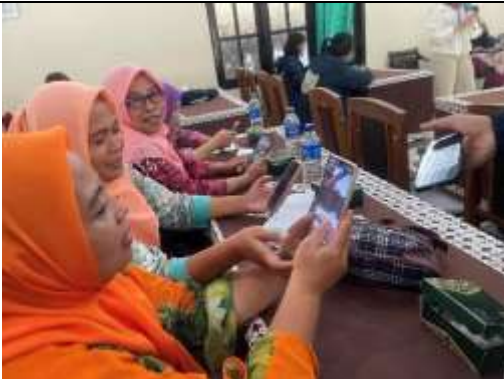
Gambar 8 Pembuatan data digitalisasi