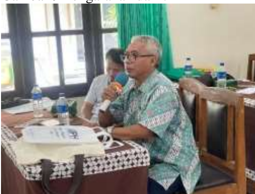
Gambar 10 Tanya Jawab Peserta PkM