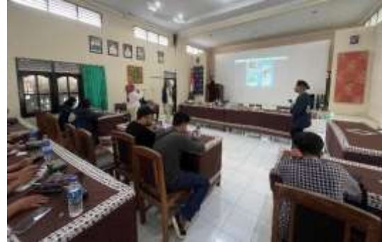
Gambar 5 Pembuatan peta destinasi

sekaligus pendampingan serta pendalaman kembali mengenai website mapping yang dibuat.