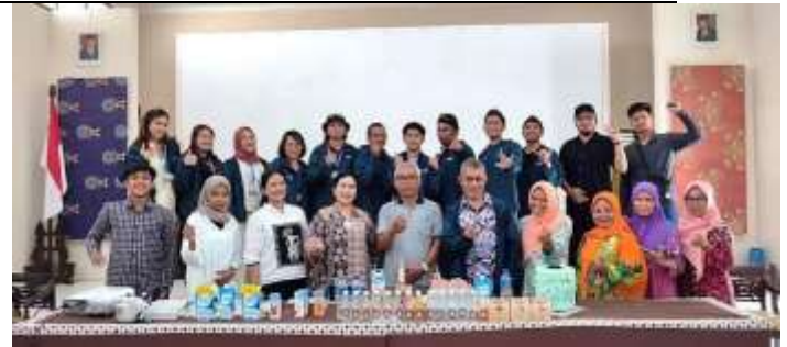
Gambar 11 Foto Bersama