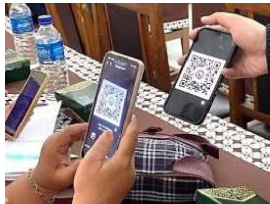
Gambar 7 Pembuatan Barcode Destinasi