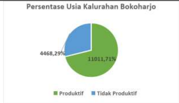
Sumber : Olahan Kelompok (2023)

Berdasarkan data diatas, terlihat bahwa umur produktif di Kalurahan Bokoharjo yakni lebih besar dibandingkan dengan umur tidak produktif, sehingga dalam hal ini memiliki kesempatan untuk bertambahnya jumlah tenaga kerja yang dapat bekerja secara produktif dan tentunya mengikuti perkembangan pariwisata pada Kalurahan Bokoharjo. Dan berdasarkan data dari PDRB pada Kalurahan Bokoharjo, terdapat potensi untuk adanya peningkatan pendapatan perkonomian, peningkatan lapangan pekerjaan, dan peningkatan peluang usaha berdasarkan dari sector pariwisata hal ini dapat dilihat dari angka PDRB di Kalurahan Bokoharjo untuk wajib pajak, pokok pajak, PBB dimana masuk ketiga kalurahan terbesar dalam pembayaran pada Kecamatan Prambanan yakni sebesar 100,11%.