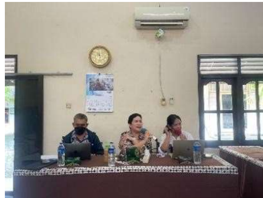
Gambar 6 Pengarahan tim