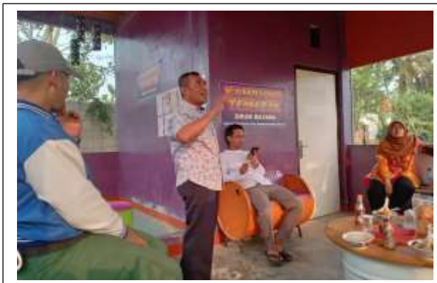
Gambar 2 Dokumentasi kegiatan

Ketua team menyampaikan bahwa tujuan dari pembuatan digital marketing sebagai tindak lanjut dari pelatihan strategi pemasaran yang telah dilakukan tahun 2022 dan kali ini khusus membuat aplikasi penjualan digital marketing untuk produk furniture Drum Bujana agar produk furniture yang dihasilkan dapat dipasarkan dalam jangkaun yang lebih luas lagi. Aplikasi akan dibuat oleh team dosen dan mahasiswa Universitas Insan Pembangunan Indonesia kurang lebih selama 5 bulan yaitu dari bulan Agustus 2023 sampai dengan Desember 2023.