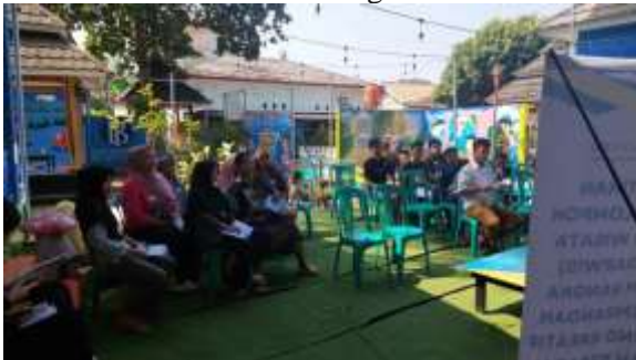
Gambar 2. Pelaksanaan Kegiatan Pelatihan

Kampung Kreatif Pipitan dikelola oleh Pokdarwis (Kelompok Sadar Wisata). Tantangan yang dihadapi oleh Pokdarwis Kampung Kreatif Pipitan yaitu potensi yang dimiliki belum dikemas dalam sebuah paket wisata yang mengintegrasikan seluruh sumber daya. Paket wisata dapat dikembangkan dengan menyusun sebuah rute perjalanan wisata dimana wisatawan dapat menikmati seluruh potensi yang ada dalam sebuah narasi yang menarik. Sebagai contoh banyak spot untuk berfoto di Kampung Kreatif Pipitan namun belum ada informasi tentang tema yang ditampilkan sebagai objek foto. Untuk menyampaikannya diperlukan cerita yang menarik yang disampaikan oleh pemandu wisata. Saat ini Kampung Kreatif Pipitan belum memiliki pemandu wisata yang dapat menyampaikan informasi tentang potensi yang dimiliki.