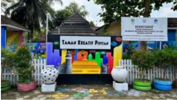
Gambar 1. Taman Kreatif Pipitan

Undang Nomor 32 Tahun 2007 yang disahkan pada tanggal 10 Agustus 2007 tentang Pembentukan Kota Serang.