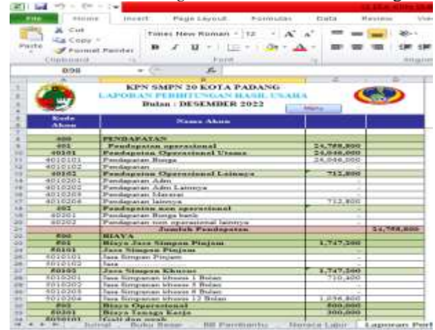
Gambar 8: Laporan Perhitungan Hasil Usaha

Usaha (SHU) bulan Desember 2022 pada Menu Excel For Accounting di KPN SMPN 20 Padang.