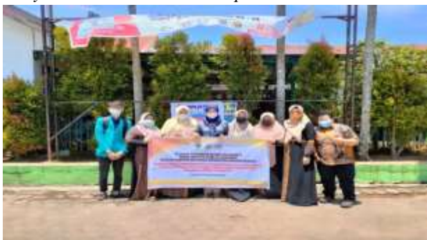
Foto Bersama Bendahara KPN SMPN 20 Padang