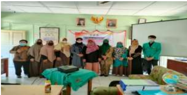
Foto Bersama Tim dan Mitra