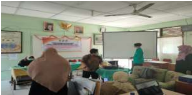
Persiapan Pelaksanaan Bimtek