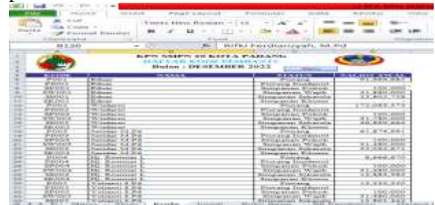
Gambar 4: Daftar Kode Pembantu

Daftar kode pada KPN SMPN 20 Kota Padang merupakan lembar kerja sebagai tabel bantu yang digunakan untuk mengetahui pihak yang akan melakukan utang atau piutang dalam bentuk simpanan wajib, simpanan pokok, simpanan wadiah, simpanan sukarela serta pinjaman yang dilakukan kepada KPN SMPN 20 Kota Padang. Adapun langkah-langkah yang dilakukan adalah sebagai berikut : Buatlah tabel halaman kerja Daftar Kode pada Sheet dengan mengisi kode, nama status, dan saldo awal; Untuk daftar kode dapat dituliskan dengan cara manual; Isikan daftar nama secara manual dan status dengan menggunakan data validation , 1) Pilih menu Data, 2) Pilih Data Validation, 3) Isikan data Settings dengan kolom Allow "List" dan kolom Source "Db;Kr;- ; Isikan saldo awal untuk transaksi hutang dan piutang yang terjadi pada KPN SMPN 20 Kota Padang. Berikut merupakan tampilan gambar daftar kode pembantu.