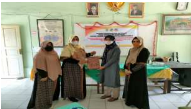
Penyerahan Cendramata Kepada Mitra