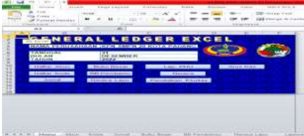
Gambar 2: Daftar Menu

Tanggal, Bulan dan Tahun. Berikut daftar menu yang telah dirancang.