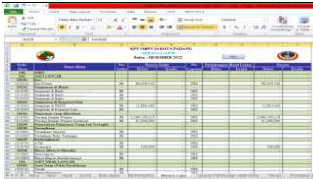
Gambar 7: Neraca Lajur

Adapun langkah-langkah yang dilakukan dalam membuat Neraca Lajur adalah : (1) Buka Microsoft Excel Accounting (software) yang telah disediakan pada sheet berikutnya setelah jurnal umum. (2) Pada bagian kode akun, isikan kode akun dengan cara manual sesuai dengan sheet daftar akun. (3) Selanjutnya, pada bagian nama akun maka tuliskan rumus sesuai dengan kode akun, dengan rumus : =VLOOKUP(A7;DAF\_AKUN;2;FALSE) (4) Lalu, pada bagian pos saldo isikan sesuai saldo normal akun, bersaldo Debet atau kredit dengan rumus : =VLOOKUP(A7;DAF\_AKUN;3;FALSE) (5) Selanjutnya masukan rumus pada kolom berikut Pada kolom Debet bagian Neraca Saldo =IF(C7="Db";SUMIF(Akun!A:A;A7;Akun!F:F)+SUMIF(Jurnal!J:J;A7;Jurnal!L:L)-SUMIF(Jurnal!J:J;A7;Jurnal!M:M);0) . Pada kolom Kredit bagian Neraca Saldo =IF(C7="Kr";SUMIF(Akun!A:A;A7;Akun!G:G)-SUMIF(Jurnal!J:J;A7;Jurnal!L:L)+SUMIF(Jurnal!J:J;A7;Jurnal!M:M);0) Pada Pos Laporan =VLOOKUP(A7;DAF\_AKUN;4;FALSE) Pada Saldo Debet bagian Sisa Hasil Usaha =IF(F7="SHU";D7;0) Pada Saldo Kredit bagian Sisa Hasil Usaha =IF(F7="SHU";E7;0) Pada Saldo Debit bagian Neraca =IF(F7="NRC";D7;0) dan Pada Saldo Kredit bagian Neraca =IF(F7="NRC";E7;0) .