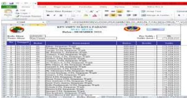
Gambar 6: Buku Besar

Berikut tampilan Buku Besar pada KPN SMPN 20 Kota.