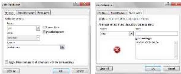
Gambar 5: List Box Kode Akun pada data validation

Bagian kode akun buatlah drop-downlist box yang berisikan daftar-daftar kode akun yang ada pada kolom akun yang telah dibuat pada halaman kerja daftar akun, sehingga ketika akan mengisi kode akun hanya cukup dengan cara klik drop-dowblist box dengan cara sebagai berikut : (1) Drop-downlist box harus terhubung dengan halaman kerja daftar akun (2) Bukalah halaman kerja daftar akun, lalu blok range kolom ke akun (3) Selanjutnya beri nama range untuk kolom ke akun dengan nama "akunbaru" (4) Kembalilah ke halaman jurnal umum, lalu blok range ke kolom kode akun (5) Selanjutnya klik menu data, kemudian pilih data validation (6) Lalu, pada kotak Allow pilih list dan hilangkan tanda entang ignor blank (7) Pada kotak source ketik "=akunbaru" nama range yang sudah dibuat pada lembar halaman kerja (8) Selanjutnya pada tab Error Alert, ketikkan Error message "MAAF ! KODE SALAH", dan klik OK (9) Lihat hasilnya pada halaman kertas jurnal umum, akan terlihat list box (10) Berikut tampilan List Box Kode yang dapat digunakan sebagai acuan untuk mengisi data validation sebagai berikut :