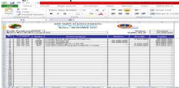
Gambar 6: Buku Besar Pembantu

Buku Besar Pembantu memberikan manfaat kepada para pengguna. Buku Besar Pembantu akan berkaitan dengan kode bantu, sehingga apabila telah mengisi Daftar Kode Pembantu sesuai dengan nama nasabah maka kode nasabah secara otomatis akan terlink kepada Buku Besar Pembantu. Berikut adalah tampilan Buku Besar Pembantu pada Menu Excel For Accounting pada KPN SMPN 20 Kota Padang, berikut tampilan Buku Besar Pembantu.