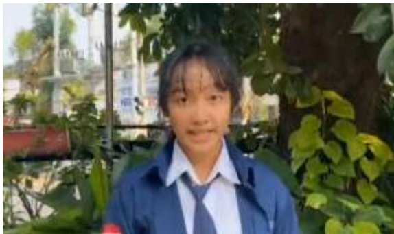
Gambar 6. Implementasi materi oleh siswa SMPN 4 Surakarta