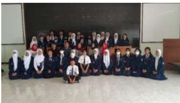
Gambar 7. Foto bersama tim Pengabdian kepada Masyarakat Universitas Telkom dengan peserta pelatihan SMPN 4 Surakarta

Tidak dapat dipungkiri bahwa keunggulan dari Pelatihan yang dilaksanakan di SMPN 4 Surakarta adalah kelas atau kelompok kecil yang dapat membuat pemateri mudah untuk fokus dan membantu tiap-tiap kelompok apabila mereka menghadapi kesulitan. Di lain pihak, kekurangannya adalah peserta yang hanya merupakan perwakilan dari keseluruhan siswa