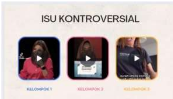
Gambar 5. Implementasi materi oleh siswa SMPN 4 Surakarta

dari 100% untuk kepuasan penyelenggaraan kegiatan pengabdian masyarakat oleh tim Abdimas. Berikut adalah bukti implementasi materi yang dilakukan oleh pelajar SMPN 4 Surakarta: