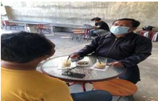
Gambar 6. Pendampingan Materi IV