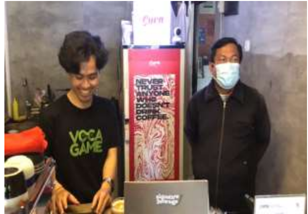
Gambar 8. Pendampingan Materi VI