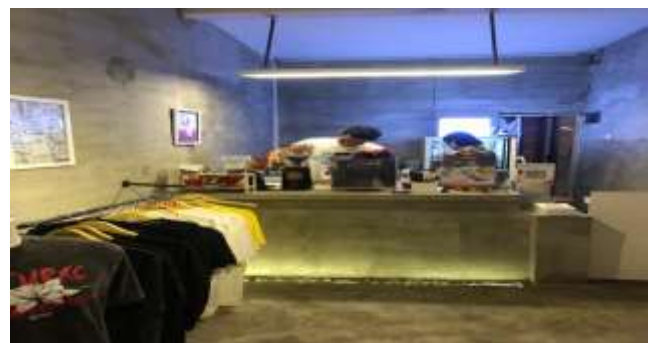
Gambar 1. Kondisi Mitra

Pengabdian masyarakat yang dilakukan berada di Jl. Ngagel Tama No. 19 Baratajaya Kecamatan Gubeng Kota Surabaya. Mitra pengabdian memiliki kegiatan di bidang coffe shop yang bertema milenial dan menargetkan pasar anak muda. Mitra Sura Coffe buka dari jam 12.00 – 00.00 setiap harinya dengan hany satu shift kerja. Berdasarkan pengamatan awal pelaksana menunjukkan beberapa gambar sebagai berikut: