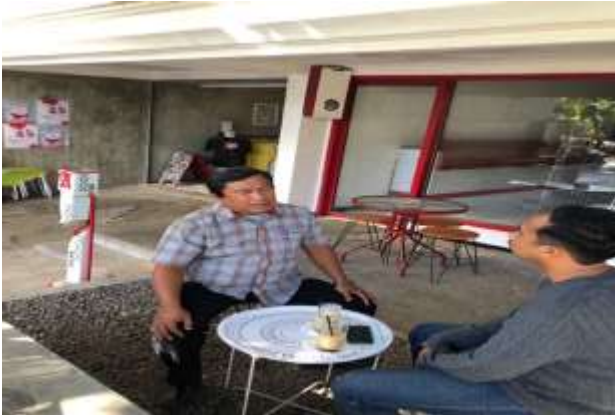
Gambar 5. Pendampingan Materi III