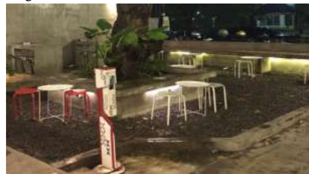
Gambar 3. Situasi Coffe Shop Mitra

Berdasarkan Gambar 2 menunjukkan kurang inovasinya promosi di marketing online sehingga konsumen yang datang hanya dari sekitar lokasi. Inovasi pada marketing online sangat diperlukan untuk menaikkan minat konsumen berkunjung ke mitra pengabdian. Selanjutnya akan dijelaskan gambar situasi mitra pengabdian sebagai berikut: