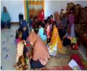
Gambar 3: Kegiatan sosialisasi dan pelatihan pada Ibu-Ibu PKK

Terlihat pada gambar 3, pada pengabdian masyarakat ini kami tidak hanya berfokus pada remaja melainkan pada masyarakat sekitar yang diwakili oleh Ibu-Ibu PKK desa Nambak, Kabupaten Ponorogo. Salah satu tujuan kami memberikan sosialisasi tentang seks bebas kepada Ibu-Ibu PKK dikarenakan masyarakat perlu tahu tentang dampak yang dihadapi anak, remaja terkait dengan seks bebas, cara menyikapi dan bagaimana cara mencegah.