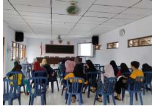
Gambar 2: Kegiatan sosialisasi dan pelatihan pada remaja.

Kami kerjasama dengan dokter setempat untuk menjadi narasumber atas kegiatan tersebut: