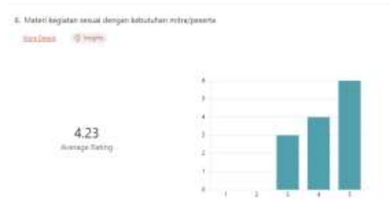
Gambar 2. Hasil Umpan Balik Pertanyaan 1