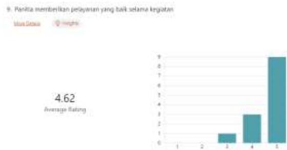
Gambar 5. Hasil Umpan Balik Pertanyaan 4