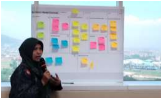
Gambar 1. Presentasi Business Model Canvass oleh peserta

Pada Gambar 1 terlihat bahwa peserta pelaku UMKM melakukan presentasi terkait usaha yang mereka dirikan. Dari adanya presentasi tersebut mereka dapat lebih mudah mengetahui hal-hal apa saja yang perlu diperbaiki ataupun dikembangkan dari usaha mereka. Mulai dari proses produksi, target pasar, sumber penghasilan, dan jaringan usaha.