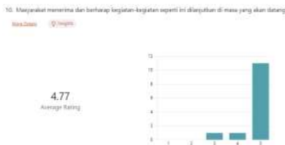
Gambar 6. Hasil Umpan Balik Pertanyaan 5

Perubahan sikap, pola pikir, dan pandangan dalam berwirausaha memiliki pengaruh terhadap manajemen usaha dan kemampuan pemilik dalam melakukan pembukuan keuangan usaha mereka, sehingga hal ini dapat menciptakan inovasi produk baru yang lebih beragam dan munculnya ide-ide baru yang dapat diterima dan dilakukan oleh para pemilik usaha (Nirmala, dkk: 2022). Hal ini tentunya sejalan dari indikator yang diukur dalam pelatihan ini. Hasil umpan balik menunjukkan rata-rata 4 dari setiap pertanyaan yang diajukan, banyak dari peserta yang mengaku sudah terbantu dengan diadakannya pelatihan. Selain itu juga, banyak dari mereka yang sudah dapat menemukan inovasi-