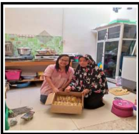
Gambar 1. Kunjungan ke Mitra

Salah satunya usaha pelaku usaha UMKM di bidang usaha kue basah yaitu penentuan harga pokok produksi (HPP). Harga pokok produksi menjadi unit terpenting dalam membentuk harga jual dari suatu produk kue basah. Hal ini sesuai dengan penjelasan Ernita et al.(2023) menjelaskan bahwa informasi harga jual produk ditentukan dari harga pokok produksi. Gambar 1 merupakan bagian dari usaha Lala Cake