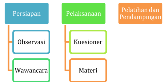
Gambar 3. Alur Tahapan Pelaksanaan Kegiatan

penggolongan biaya, biaya produksi, harga pokok produksi, dan harga jual, serta manfaat mempelajari biaya-biaya tersebut bagi mitra. Tahap ketiga adalah pendampingan dari tim pengabdian ke mitra dalam bentuk menyusun dan menghitung harga pokok produksi secara rinci dan harga jual ke mitra. Tahap empat adalah melakukan evaluasi sebagai post-test sejauh mana pelatihan dan pendampingan yang telah dilaksanakan telah mampu mendorong peserta memahami perhitungan harga pokok produksi dan harga jual.