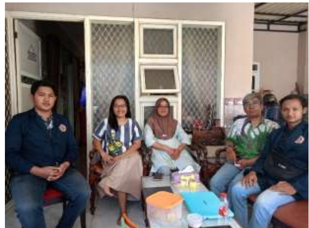
Gambar 7. Foto Bersama Di Akhir Sesi

Pada tahapan ini, Mitra kembali diberikan 8 pertanyaan yang sama. Tujuan pertanyaan ini untuk mengevaluasi sejauh mana mitra memahami dan mengerti materi yang telah disajikan. Hasil dari evaluasi ini diperoleh 100% seperti pada tabel 2 dan gambar 7 telah memahami dan memiliki bekal pengetahuan jika diminta menentukan harga pokok produksi dan harga jual.