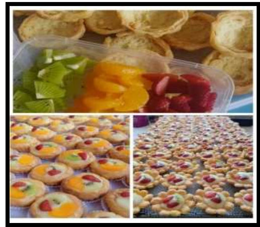
Gambar 2. Kue Basah Sus

Kue Sus yang diproduksi oleh Ibu Ika merupakan jenis kue basah yang banyak digemari warga dibandingkan dengan kue basah lainnya. Untuk pesanan Kue Sus, Ibu Ika menerima pesanan ini minimal 35 pcs. Dalam usaha yang dijalankan, Ibu Ika dibantu oleh 2 tenaga kerja yang sifatnya serabutan seperti pada gambar 2b. Hasil observasi secara langsung pada gambar 2c menunjukkan bahwa perhitungan harga pokok produksi yang tepat untuk usaha ini menggunakan job order costing . Alasan penggunaan JOC adalah pelaku usaha memproduksi kue sus berdasarkan pesanan serta metode ini mudah dilakukan dan tidak membutuhkan biaya banyak.