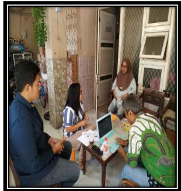
Gambar 5. Penyajian materi dan diskusi

Setelah pelaksanaan presentasi oleh tim pengabdian selesai dilakukan, maka selanjutnya melakukan pengumpulan data yang berkaitan dengan proses produksi kue sus mulai biaya bahan baku, biaya tenaga kerja, dan biaya overhead . Selanjutnya akan dilakukan penggolongan biaya sesuai klasifikasi biaya. Penggolongan biaya ini penting dilakukan untuk menentukan harga pokok produksi dan harga jual sesuai metode Job Order Costing . Terakhir, dari penggolongan biaya tersebut, tim menghitung biaya produksi, harga pokok produksi, dan harga jual.