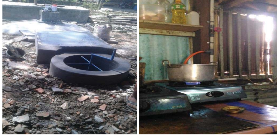
Gambar 2. Revitalisasi Instalasi Biogas