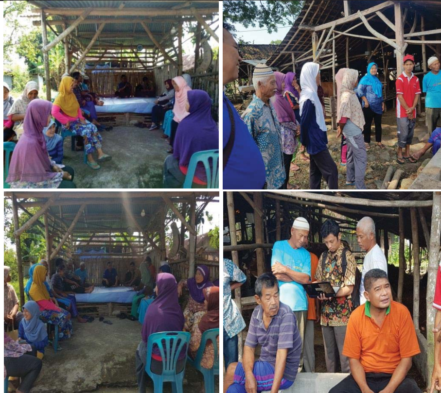
Gambar 1. Penyuluhan dan Pelatihan Cara Kerja dan Pembuatan Biogas