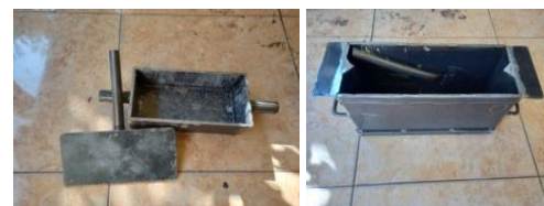
Gambar 6. Hasil alat cetak paving

Alat cetak didesain secara manual agar mudah dalam penggunaan dan perawatan. Cetakan terbuat dari pelat besi dengan tutup yang bisa dilepas saat proses pencetakan.