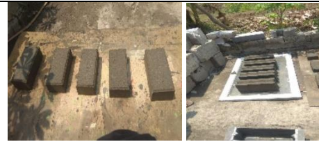
Gambar 7. Hasil cetakan Paving dan Batako

Selanjutnya dilakukan percobaan pembuatan Paving dengan campuran semen, pasir, abu dan air. Komposisi campuran Pasir, Semen dan Abu (1:1:2) untuk Paving dan (1:1:4) untuk Batako. Setelah dicetak, dilakukan pengeringan secara manual atau alami selama kurang lebih 3-4 minggu. Hal ini bertujuan agar Paving terbentuk sempurna dan kuat serta menurunkan kadar air. Sehingga Paving mempunyai kualitas yang baik.