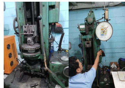
Gambar 8. Pengujian kuat tekan paving

Setelah Paving dikeringkan, selanjutnya dilakukan pengujian kuat tekan. Pengujian ini bertujuan untuk mengetahui seberapa besar kuat tekan pada produk Paving yang dihasilkan dan kesesuaian dengan standar SNI.