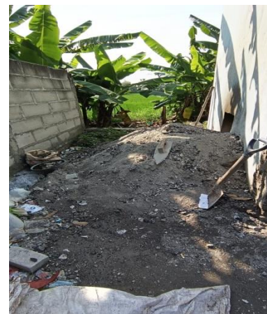
Gambar 2. Tumpukan Abu Insenerasi

Berdasarkan hasil analisis situasi tersebut serta diskusi dengan mitra, permasalahan yang akan diselesaikan dalam program PPM ini adalah permasalahan pada aspek produksi dan sumber daya manusia. Permasalahan pada aspek produksi adalah mitra belum mempunyai teknologi tepat guna (TTG) untuk mengolah abu hasil incenerator menjadi bahan bangunan seperti batako, paving atau lainnya yang mempunyai nilai tambah. Saat ini abu hanya dijadikan sebagai bahan urugan dilahan kosong yang dapat mnyebabkan pencemaran pada lingkungan. Permasalahan pada aspek sumber daya manusia yaitu, mitra belum mempunyai kesadaran akan bahaya akibat pencemaran abu hasil pembakaran sampah. Selain itu mitra tidak mempunyai pengetahuan cara untuk mengolah abu hasil incenerator menjadi batako atau bahan bangunan lainnya.