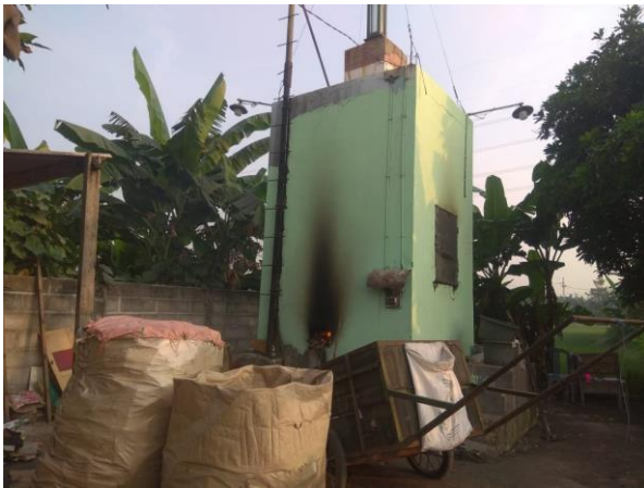
Gambar 1. Incenerator tempat pengolahan sampah

elemen besi beton dipanaskan dengan membakar kayu kering dan kertas dari sisi bawah sampai elemen terlihat membara. Setelah itu sampah dari warga dimasukkan ke dalam lubang bagian sisi atas Incenerator. Sampah yang masih basah akan layu karena pemanasan dari elemen dan secara perlahan akan turun dan terbakar. Abu sisa pembakaran akan turun pada bagian sisi bawah. Abu ini yang kemudian dikumpulkan dan dibuang di lahan kosong atau sebagai urugan.