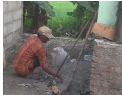
Gambar 4. Pengumpulan abu insenerasi

sampah basah dan residu dimasukkan ke dalam insenerator. Abu hasil pembakaran (abu insenerasi), dikumpulkan dan diayak untuk dijadikan paving atau batako.