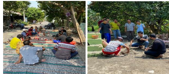
Gambar 5. Sosialisasi dan Pelatihan pada Mitra

Mitra juga diberikan pelatihan terkait pembuatan Paving dan Batako. Mitra diberikan pengetahuan bagaimana mempersiapkan bahan dan melakukan perhitungan komposisi semen, pasir, abu dan air. Mitra juga diberikan pengetahuan tata cara mencetak dengan benar.